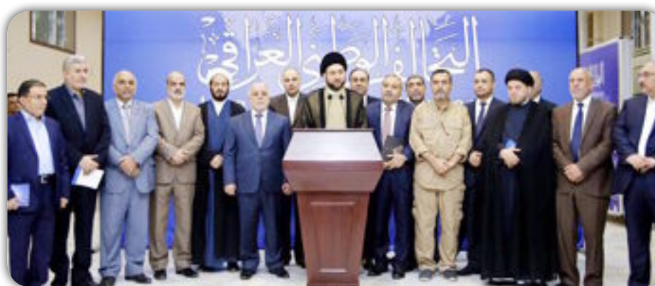
والقائد العام للقوات المسلحة شرح فيه تطور سير العمليات العسكرية وما حققتة قواتنا المسلحة وقاب ان "التحالف الوطني يبارك تشريع قانون

ينظم هيئة الحشد الشعبي بوصفها جزءاً لا يتجزأ من منظومة القوات المسلحة التي تعمل لحفظ سيادتنا الوطنية وضمان أمنه واستقراره وينصف من لبي النداء الوطني دفاعاً عن اراضيه ليكون ضامناً لحقوقه متتسبياً ومنظماً لعملهم وسيستمر التحالف الوطني بمساعيها لطمئنة باقي الشركاء ومناقشة مقترحاتهم . كما صادقت الهيئة العامة للتحالف الوطني، على النظام الداخلي للتحالف. وذكر بيان لمكتب رئيس التحالف الوطني السيد عمار الحكيم ان " التحالف الوطني يبارك في اجتماع هيئته العامة الانتصارات المتحققة بتحرير اجزاء واسعة من محافظة نينوى من سيطرة زمر داعش الارهابية ضمن عمليات قادموين يا نينوى".