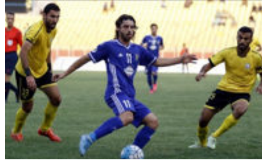
بغداد ضد أربيل، والنجم في مواجهة القوة الجوية، وراخو ضد الحسين، والميناء أمام ضيفه الزوراء، والشرطة ضد الكهرباء.

حددت لجنة المسابقات في اتحاد الكرة مواعيد الجولة العاشرة من الدوري الممتاز، حيث تقام 4 مباريات يوم الإثنين المقبل، و6 مباريات يوم الثلاثاء. وقال رئيس لجنة المسابقات، شهاب أحمد، في تصريح صحفي، إن السماوة يواجه نطق ميسان، فيما يستقبل الكرخ، نظيره النطق، ويغادر كربلاء إلى النجف ليحل ضيفاً على فريق نطق الوسط، فيما سيكون البحري ضيفاً على الحدود في مباريات الإثنين. وأشار إلى أن يوم الثلاثاء يشهد إقامة مباريات الطلبة أمام ضيفه نطق الجنوب، وأمانة