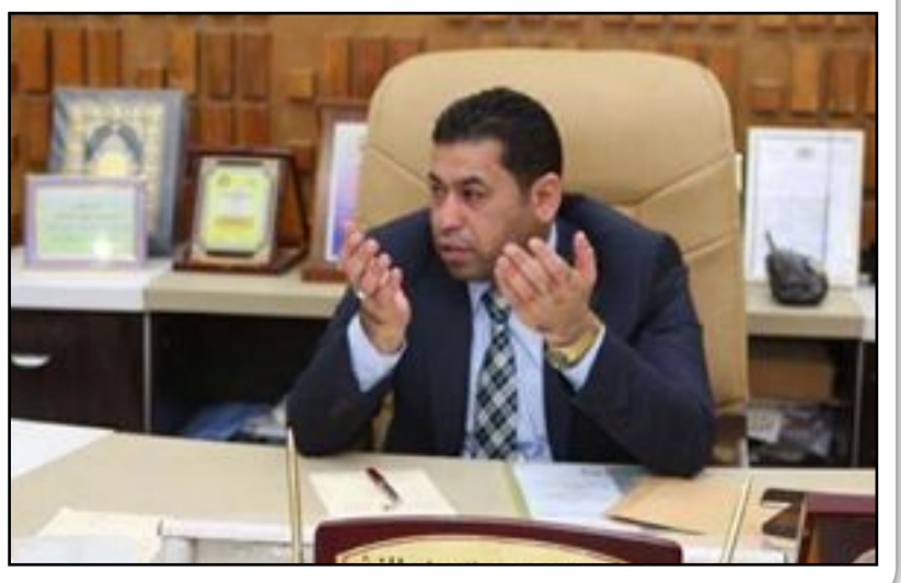
دعا محافظ بابل صادق السلطاني الى اخذ أقصى درجات الحيطة والحذر وان نكون العيون الساهرة لمنع حدوث اي خروقات امنية. جاء ذلك خلال الاجتماع الأمني الذي عقده السلطاني بالقائدات الامنية في المحافظة لمناقشة الوضع الأمني في محافظة بابل بشكل عام وتحديد اهم المعوقات التي تواجه افراد قواتنا الامنية وتبليغها ومنع اي شغرة تسمح للإرهاب ان يستغلها لتنفيذ خطته الجبانة خاصة وانه اليوم يشهد انهزام كبير وانتصارات الأبطال التي يحققها جيشنا الباسل والشرطة الاتحادية والمحلية وحشدنا المقدس جعلته مهزوز وبأنفاسه الاخيرة وعلينا ان لانسمح لهم ان يحققوا اي خرق أمني في محافظتنا ولانضيق فرجة كل هذه الانتصارات وكل هذا يأتي بوقوفنا صفاً واحداً وتعاون الجميع وتقديم كل الدعم لمتسببنا من اجل ان يكونوا العيون الساهرة لسلامة أبناء بابل. وشدد السلطاني على اخذ

العراق الاخبارية / حيدر حسن دعا محافظ بابل صادق السلطاني الى اخذ أقصى درجات الحيطة والحذر وان نكون العيون الساهرة لمنع حدوث اي خروقات امنية. جاء ذلك خلال الاجتماع الأمني الذي عقده السلطاني بالقائدات الامنية في المحافظة لمناقشة الوضع الأمني في محافظة بابل بشكل عام وتحديد اهم المعوقات التي تواجه افراد قواتنا الامنية وتبليغها ومنع اي شغرة تسمح للإرهاب ان يستغلها لتنفيذ خطته الجبانة خاصة وانه اليوم يشهد انهزام كبير وانتصارات الأبطال التي يحققها جيشنا الباسل والشرطة الاتحادية والمحلية وحشدنا المقدس جعلته مهزوز وبأنفاسه الاخيرة وعلينا ان لانسمح لهم ان يحققوا اي خرق أمني في محافظتنا ولانضيق فرجة كل هذه الانتصارات وكل هذا يأتي بوقوفنا صفاً واحداً وتعاون الجميع وتقديم كل الدعم لمتسببنا من اجل ان يكونوا العيون الساهرة لسلامة أبناء بابل. وشدد السلطاني على اخذ