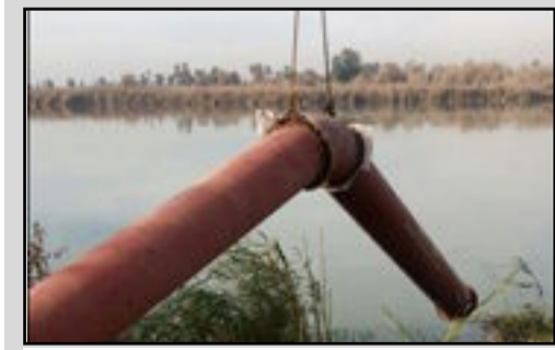
المص الخاص بالمضخة المتريه الرابعة في محطة صدر الوحدة

مديرية الموارد المائية في بغداد تباشر باعمال الربط للممص الخاص بالمضخة المتريه الرابعة في محطة صدر الوحدة