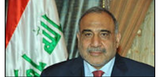
عادل عبد المهدي