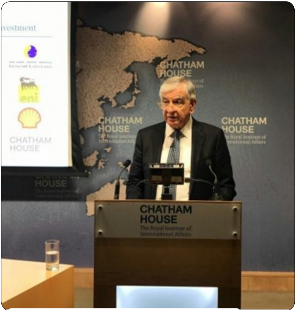
وزير النفط، جبار الجبوري، خلال مشاركته في ورشة - جاثام هاوس - بالعاصمة البريطانية

قدم وزير النفط، جبار الجبوري، خلال مشاركته في ورشة "جاثام هاوس" بالعاصمة البريطانية، خطط تطوير الصناعة النفطية والاستثمار الامثل للغاز المصاحب للعمليات النفطية، مؤكداً الحرص على الاستثمار الامثل للثروة. وأكد الجبوري في بيان للوزارة "حرص العراق على الاستثمار الامثل للثروة الوطنية من خلال تشجيع التعاون والشراكة بين الشركات الوطنية والعالمية الرصينة، جاء ذلك خلال الكلمة التي القاها في ورشة "جاثام هاوس" التي تعنى بشؤون النفط والطاقة والتي تعقد في العاصمة البريطانية بمشاركة عدد من وزراء النفط والطاقة والشركات والخبراء المهتمين بقطاع النفط والطاقة". واستعرض وزير النفط خطط وبرامج الوزارة في تطوير الصناعة النفطية والاستثمار الامثل للغاز المصاحب للعمليات النفطية، فضلاً عن النهوض بالبنى التحتية وقطاع التصفية وتعزيز التعاون مع دول الجوار من خلال إقامة المشاريع الاستراتيجية. وقال البيان ان "للجبوري التقى على هامش الورشة بنظيره وزير البترول المصري طارق الملا وجرى خلال اللقاء بحث سبل تعزيز العلاقات الثنائية بين البلدين الشقيقين".