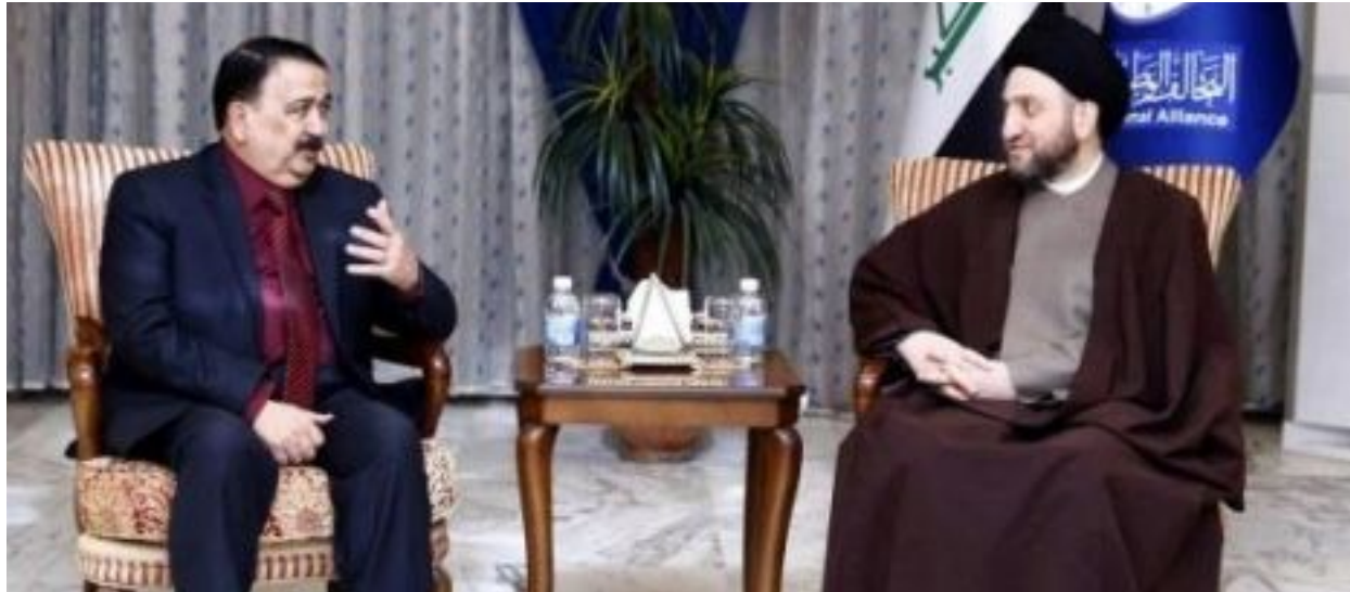
بغداد- العراق الاخبارية

أكد رئيس التحالف الوطني السيد عمار الحكيم ضرورة النهوض بواقع وزارة الداخلية. وذكر بيان لرئاسة التحالف الوطني ان "السيد عمار الحكيم التقى وزير الداخلية قاسم الاعرجي وبارك له تسنمه مهام وزارة الداخلية "متمنياً" له النجاح والموفقية في عمله ، كما جرى خلال اللقاء استعراض الأوضاع الأمنية في البلاد ومعرفة تحرير الموصل". وشدد السيد عمار الحكيم على ضرورة بذل الجهود من اجل النهوض بواقع الوزارة وصولاً إلى تحقيق الأمن للمواطن". يشار الى ان مجلس النواب قد صوت الاثنين من الاسبوع الماضي على اختيار قاسم الاعرجي وزيراً للداخلية