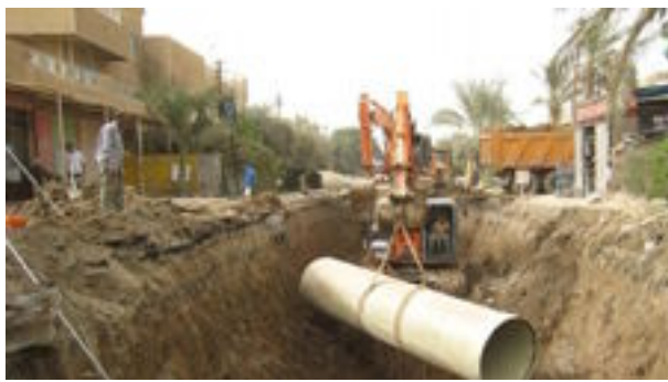
بغداد- العراق الاخبارية

اعلنت امانة بغداد، الاربعاء، عن سيطرتها الكاملة على تصريف مياه الصرف الصحي والأمطار من خلال مشروع الرستمية «التوسيع الثالث» التي تصله المياه عبر الخط الناقل «زبلن».