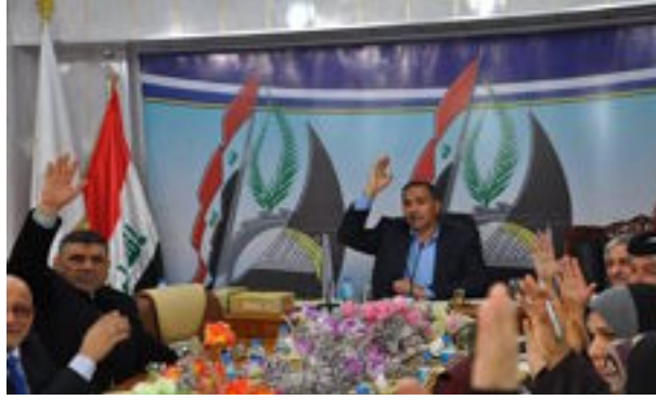
ميسان- العراق الاخبارية

صوت مجلس محافظة ميسان على رفض الخصخصة المتعلقة بقطاع الكهرباء في المحافظة.