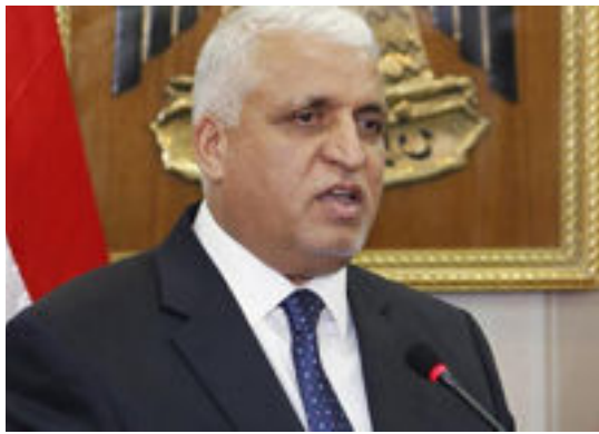
بغداد- العراق الاخبارية

الفياض: الحشد الشعبي سيمسك الاراضي القريبة من الحدود السورية