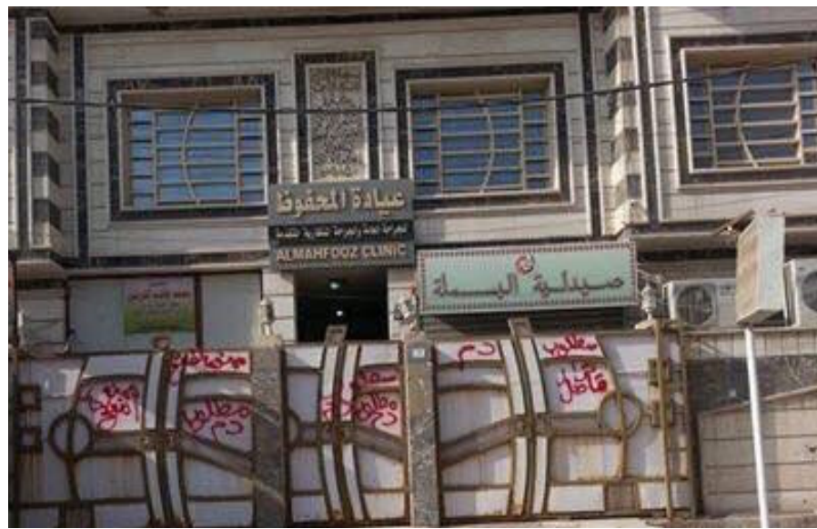
بغداد- العراق الاخبارية

يشار الى ان الكوادر الطبية تعرضت لعدة اعتداءات في بغداد والمحافظات على ايدي ذوي المرضى المتوفون خلال العمليات الجراحية، وتعرض الكثير من الاطباء الى «الكوامة» العشائرية في حين طالبت تلك الكوادر بحمايتها من هذه الظاهرة الاجتماعية التي قد تؤدي الى هجرة الاطباء ."