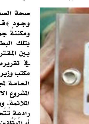
بغداد- العراق الاخبارية

وأكد التقرير على أهمية وضع سقف زمني يكفل دفع المواطنين إلى مراجعة الدوائر المختصة لإصدار البطاقة