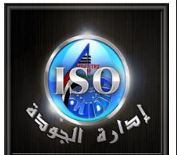
بغداد- العراق الاخبارية

اعلنت وزارة النقل، تاهيل تشكيلاتها للحصول على شهادة الأيزو الدولية.