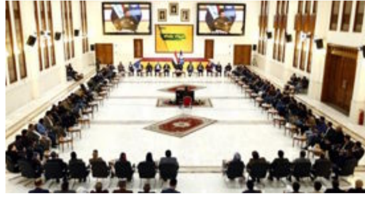
بغداد- العراق الاخبارية

المجتمعي". ودعا القيادات الشبابية الى "قراءة الواقع السياسي والنظام البرلماني المعتمد على الكتل السياسية وعليهم إذا ما أرادوا التأثير والحضور السياسي ان ينخرطوا في الكيانات السياسية التي تتسجم مع أفكارهم ، فيما شدنا على أهمية ان يتناسب سن الترشيح مع سن السماح بتشكيل الأحزاب ، وحذرنا من