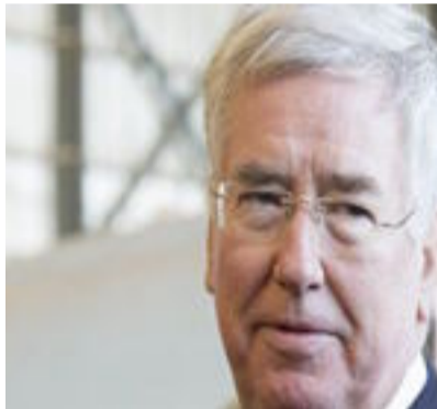
بغداد- العراق الاخبارية

على مناطق محدودة مقارنة بالفترة التي اعتقت هجومه الواسع في حزيران ٢٠١٤. وقال الوزير البريطاني "نتوقع أن يتم طرد داعش من المدن الرئيسية في العراق عام ٢٠١٧، لكنه اشار الى ان استعادة الرقة، المقر الرئيسي لتنظيم داعش في سوريا حيث ينشط التحالف الدولي ايضا، قد تكون "أكثر تعقيدا بسبب الحرب الأهلية" الدائرة في هذا البلد الجاور للعراق. وردا على سؤال حول قرار الحكومة البريطانية الفاء جهاز مكلف التحقيق في اتهامات بانتهاكات حقوق الانسان ارتكبتها عسكريون بريطانيون في العراق قال فالون ان ممارسات هذا الجهاز اتضحت انها "غير نزيهة". وتم انشاء "فريق المزامع التاريخية في العراق" في ٢٠١٠ من جانب الحكومة العمالية السابقة. وهو يحقق حاليا في ٦٧ قضية بينها مزامع قتل.