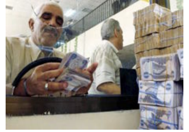
بغداد- العراق الاخبارية

أعلن مصرف الرافدين، الأحد، عزمه إقامة دعاوى قضائية ضد الملكين والمتصلين الذين لم يلتزموا بتسديد الأموال التي بذمتهم، مشدداً على أهمية التعامل بشفافية ونزاهة من قبل المواطنين المستفيدين من خدمات المصرف والالتزام بالتعهدات التي قطعها إليه.