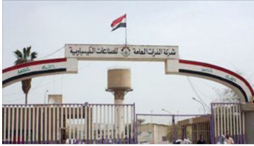
بغداد- العراق الاخبارية