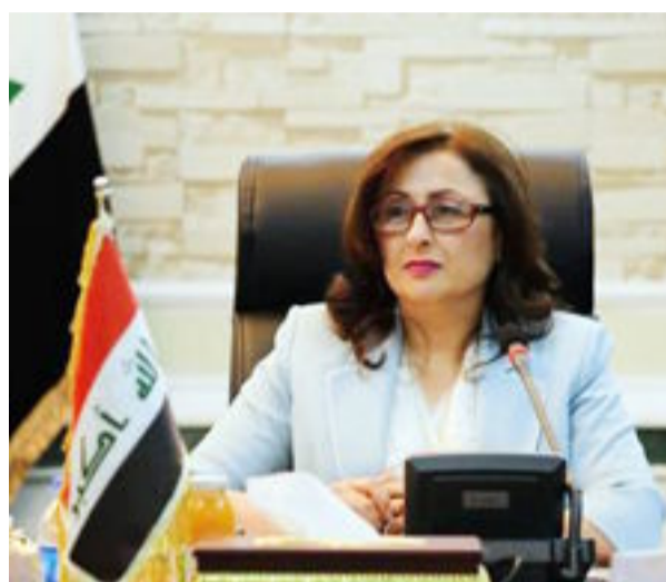
بغداد- العراق الاخبارية

نالت وزير الأعمار والاسكان د. الهندسة أن نافع أوسي المرتبة الاولى كأفضل وزير في الحكومة العراقية حسب الاستفتاء الذي اجراه اتحاد وكالات الانباء العراقية وتم تكريمها بدرع الاتحاد لهذا النجاح. جاء ذلك خلال احتفالية اقيمت بحضور عدد من الوزراء واعضاء مجلس النواب والشخصيات الامنية والحكومية لعرض نتائج الاستفتاء الذي اجراه اتحاد وكالات الانباء العراقي وشمل شراخ متنوعة من المجتمع ولدة اربعة اشهر، حيث تم اختيار السيدة الوزير بالمرتبة الاولى كأفضل وزير استنادا على نتائج الاستفتاء الالكتروني فضلا