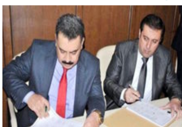
كركوك- العراق الاخبارية