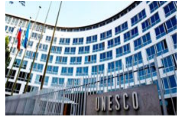
العراق الاخبارية- متابعة

وضعت منظمة الأمم المتحدة للتربية والعلم والثقافة "اليونسكو"، السبت، خطة عمل طارئة للحفاظ على المواقع الأثرية في العراق. وذكرت اليونسكو، في بيان إن "مؤتمر التنسيق المعني بحماية التراث الثقافي في المناطق المحررة في العراق وضع خطة عمل طارئة على الأجلين المتوسط والبعيد من أجل الحفاظ على مواقع البلد الأثرية التي تعود لآلاف السنين وما فيها من غنى وتنوع، فضلاً عن المتاحف والتراث الديني والمدن التاريخية".