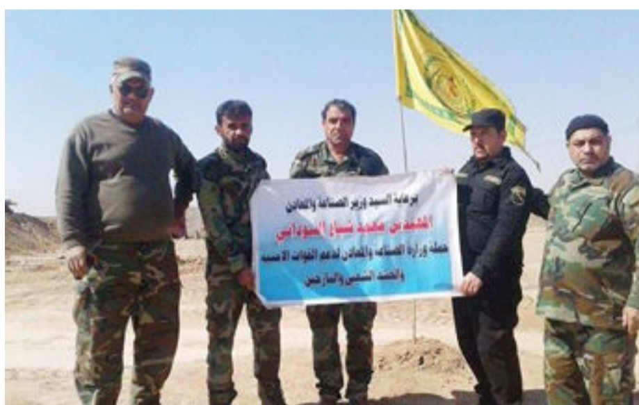
بغداد- العراق الاخبارية

بتوجيه ومتابعة مباشرة من وزير الصناعة والمعادن المهندس محمد شياع السوداني نفذت وزارة الصناعة والمعادن حملة تطوعية جديدة خلال شهر شباط الجاري ضمن سلسلة الحملات التطوعية التي تقوم بها ولشهر الثالث على التوالي من اجل دعم القوات المسلحة من الجيش والشرطة والابطال من فصائل الحشد الشعبي المقدس المرابطين في قواطع العمليات العسكرية. واكد مدير مركز الاعلام والعلاقات العامة في الوزارة