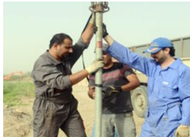
العراق الاخبارية / منى خضير عباس