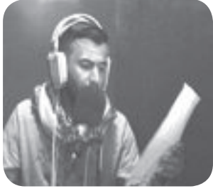
شعر / ذوالفقار الخشالي

سبع اسنين حينة وكله كالت لا لان شافو عسكنة من الحجر اسلند تعذبنة وسمعنة من الشماتة الذي وتحملنة الذي ما شاله اي احد كضينة العمر تتبادل الحسرات وخلينة الجرح بالحسرة حق ينشد واشوهسة العمر اللحضة ميت عام عبك والليالي بروحي تتفهره بوجهي اتسددت بخلافك السيبان وحت باب الصبر ابوجهي والله اتسد الشماتة بغيبتك صارت عليه وحوش وحته الي يواسي بظهري صاير نسد