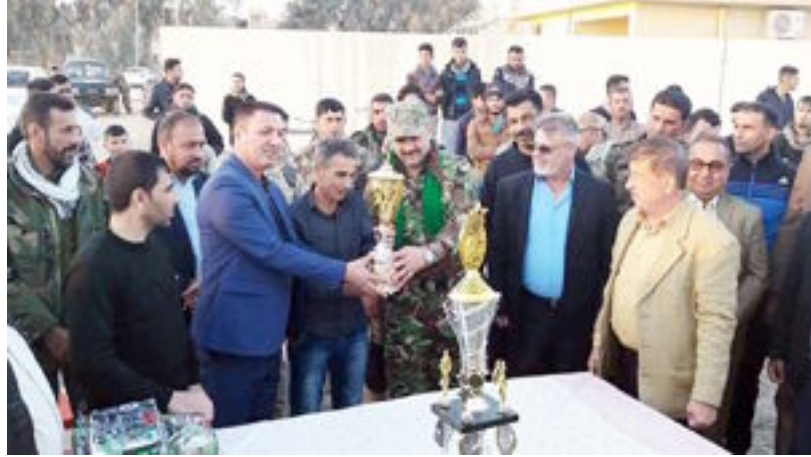
الكرخ وعدد من أعضاء المجلس المحلي في الجوائز والهدايا التقديرية للفريقين الناحية وشخصيات رياضية ، وتم توزيع ، واللاعبين المتميزين وحكام المباراة .