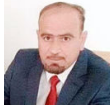
بقلم / ظافر قاسم آل فونه

النهر (....) إن قناة قاطول - النهروان تجري أسفل بقوية مسافة - ٢٠ ميلاً - على مجرى هذا النهر (.....). وطول نهر ديالى يقدر ب (٤٥٠) كيلو متر، ويبدأ من المرتضعات الجبلية الحدودية مع (إيران) وينتهي في مصب في جنوب (بغداد)، ويفصل هذا النهر مدينة (بهرز) عن ناحية (بني سعد) ويشكل هذا النهر ظاهرة جغرافية بارز وهي تكوين (الرقاق) جمع (رققة) في الهجرتا الهرزوية (ركة) . ويبسبب انحدار نهر ديالى الشديد فقد ترك مجراه القديم في الأزمنة الحديث، ومياه هذا النهر قد استفادت منه مدينة بهرز بشكل مباشر وغير مباشر لأن الأراضي الممتدة بمحاذاة نهر ديالى مرتفعة لا يمكن سقيها منه سحياً وبالخصوص الأراضي في ضواحي مدينة بهرز حيث لا تصل إليها مياه نهر خراسان فقد شرعت الدولة عام (١٩٢٦) في (قانون تشويق الزراعة) باستعمال المضخات الزراعية ونص القانون على إعطاء الأراضي التي تروى بالمضخات من كثير من الأجور والضرائب مما حفز أصحاب رؤوس