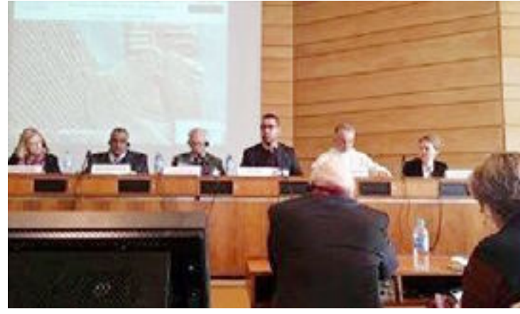
المتابعين، تناول فيه الأطر القانونية لحماية الموروث الثقافي والديني في العراق والجهود الكبيرة التي يبذلها الأبراهيمية الكبيرة التي تعرضت لها