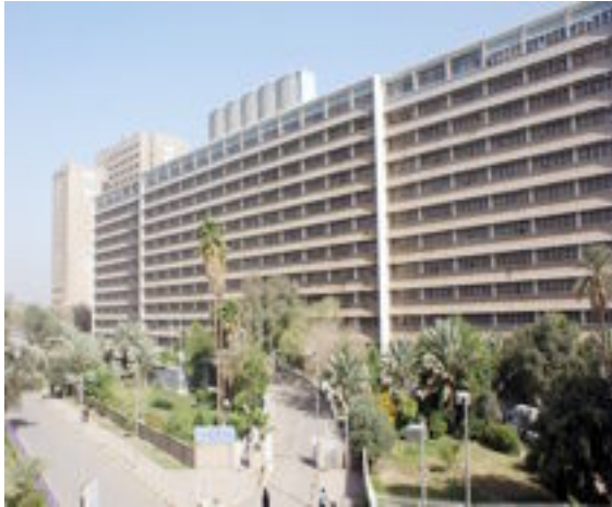
العراق الاخبارية / بغداد