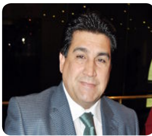
العربي اشاد بالجهود الوطنية للعاملين في الفرق الفنية والهندسية التابعة للشركات

النفطية والجهات الساندة في التعامل مع حرائق الآبار التي توصف بالعملية المعقدة والشاقة لكن الاندفاع والحرص والخبرة والجهود المحصلة للعاملين ساهمت في اختزال الوقت والجهد والتفقات، مبيناً ان "الجهود في هذه الفرق تتواصل للسيطرة على البئر النفطي الذي اشعلته عصابات داعش الارهابية بعد هروبها من القيارة". وأشار جهاد إلى ان "الفرق الفنية تجري حالياً معالجة العيوب التي زرعتها العصابات الارهابية في محيط هذا البئر". يذكر ان عدد ابار حقل القيارة يبلغ ٥٠ بئراً تعرضت ٣٤ منها لعمليات تخريبية مختلفة منها ١٨ بئراً اشعلت فيها الحرائق.