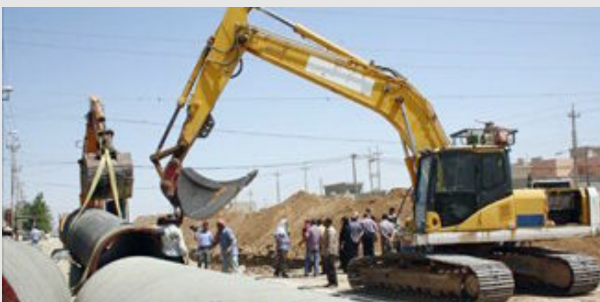
بغداد- العراق الاخبارية

وذكر المركز الاعلامي للوزارة ان شركة الفاو العامة احدى تشكيلات الوزارة شارفت على انجاز مشروع شبكة انابيب حديثة تتلائم مع متطلبات الواقع النفطي لمنطقة الفرات الاوسط حيث تبلغ طول هذه الانابيب (٢٧) كم، فضلاً عن توفير (٣٠) مضخة وقود