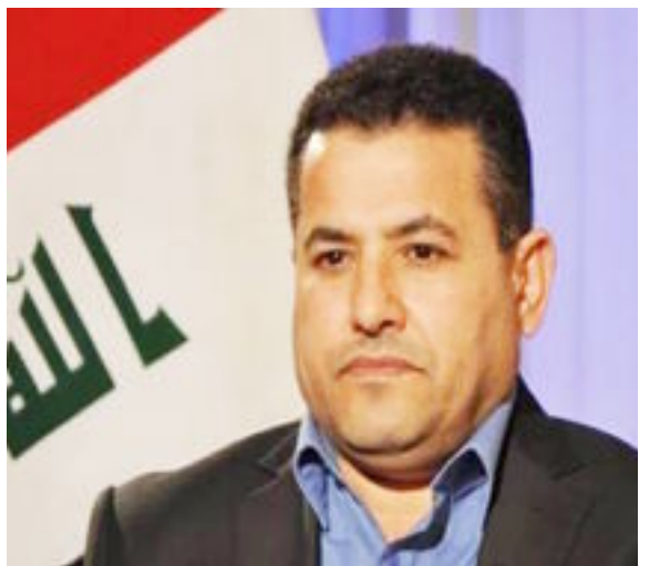
بغداد- العراق الاخبارية

أعلن وزير الداخلية قاسم الأعرجي، الأربعاء، أن مديرية الدفاع المدني قدمت ٣٣٤ شهيداً، وفيما دعا أصدقاء العراق لدعم الداخلية ومديرية الدفاع المدني لمعالجة الكوارث واحتواء الأزمات، أكد أن وزارته ستوزع الوجبة الأولى من سندات الأراضي لذوي الشهداء الأسبوع المقبل.