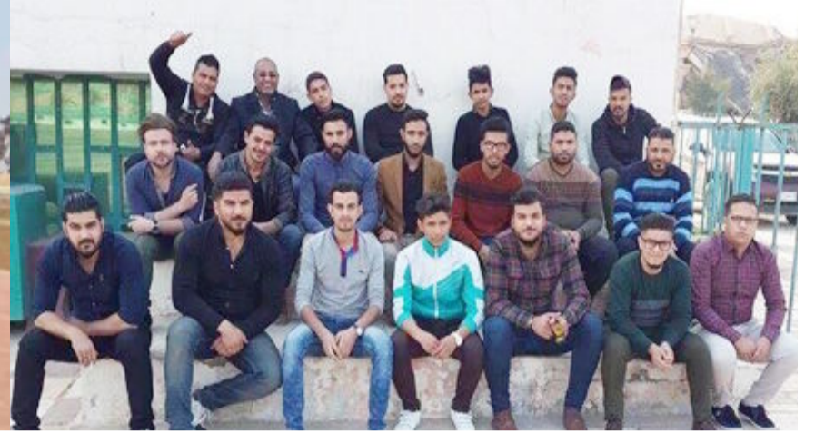
العراق الاخبارية / علي الصوفي

سيقام فريق ترنات في ملعب نادي ديالى الرياضي مهرجانا عاما وشاملا في شتى المجالات وذلك يوم ٢١ / ٣ / ٢٠١٧ بمناسبة اعياد الربيع ، مدير الفريق