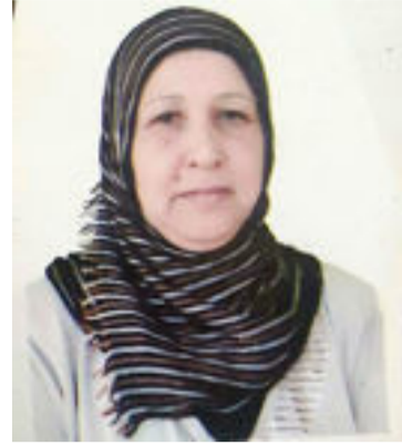
ظهيرة هادي بحر

في كل البلدان المتقدمة التي تطمح إلى بناء مجتمعات راقية ترسل بالحياة الحرة الكريمة لا بد من وجود تخطيط مسبق يتبنى كل أوجه الحياة ومنها ما يمس حياة المواطن ومصدر رزقه.