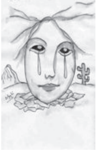
شعر / صباح المهدي

ضميت لجرحك ضمدا وامنيتي اشوكك بالسعد بطاريك من اسمع احن فدوه لك المن تون هم تسوه دنياك نوح وناسك تعذب والروح الوكت لابس نص ردن فدوه لك المن تون بوينيك اتبجي الهادي والنوح يتحده الهادي من ونك كليبي يون فدوه لك المن تون ماضن وره اللونه ريح اتوجه بكليبي السمح حنن كليبي وانه احن فدوه لك المن تون