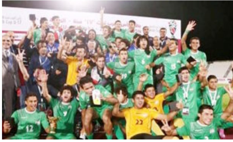
ويانتظار الموافقات الرسمية لإقامة المباراة، مشيراً إلى أن المنتخب سيفتح الباب للمشاركة المهمة.