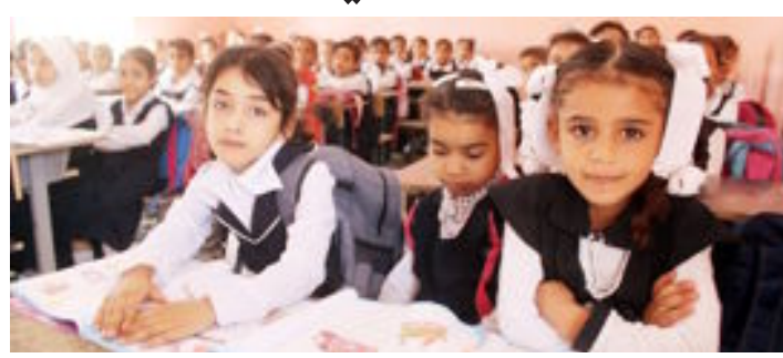
البصرة- العراق الاخبارية

بنائية المدرسة وبجهود تطوعية خالصة . وقال الناطق الاعلامي لوزارة التربية ابراهيم سبتي ان هذه الحملة هي من ضمن حملة مدرستنا بيتنا التي اطلقتها معالي وزير التربية الدكتور محمد اقبال عمر الصيدلي . وازدادت سبتي ان الحملة شملت