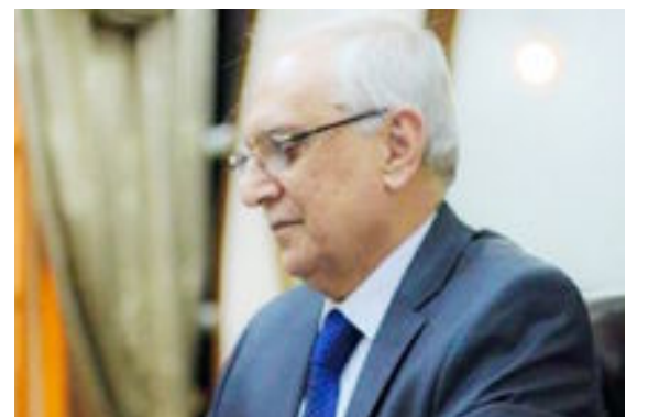
بغداد- العراق الاخبارية

هنأ وزير التعليم العالي والبحث العلمي عبدالرزاق العيسى المرأة العراقية بمناسبة يوم المرأة العالمي . وقال العيسى نتقدم بأحر التهاني للمرأة العراقية التي صارت مثالا تقتدي به كل نساء العالم ، فهي أم لبطل أو زوجة أو أخت له أو ممتحنة بشهيد أو جريح ، وهذا ما يجعلها قدوة فريدة لكل نساء العالم ، فكيف إذا كانت هي نفسها الطالبة والاساتذة الجامعية وعميدة الكلية والشاعرة والأديبة . في يوم المرأة العالمي تمنى للمرأة العراقية أن تقر عينها بتحقيق آمالها وطموحاتها ، فلا يجد يصنعها الرجل وحده من دون مشاركة المرأة ، فكل عام ونساء العراق بألف خير وسلام ومحبة .