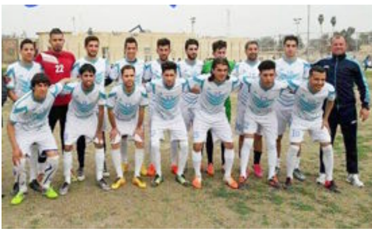
العراق الاخبارية / علي الصوفي

مباراة القمة والمحبة والاخوة والسلام نهائي الحلم بين فريق الخالص وفريق بهرز وعلى ملعب بهرز الاولمبي وبرعاية وتنظيم منتدى الفرق الشعبية الرياضية في ديالى في الساعة الثالثة عصرا وعلى ملعب بهرز الاولمبي ( نهائي بطولة السيادة والوحدة الوطنية ) بين منتدي الفرق الشعبية قضاء الخالص مع منتدي الفرق الشعبية ناحية بهرز بالدعوة عامة للجميع .