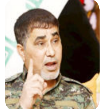
بغداد