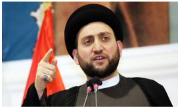
بغداد- العراق الاخبارية

الاقضية والنواحي حيث وصل عدد الشهداء من بينهم الى ثلث عددهم، واصفا استشهاد ما يقارب ٨٠٠ شخص من هذه المجالس بالرقم الممهور بالنسبة لتعددهم الكلي البالغ اكثر من ٣ آلاف عضو، ويبين مستوى المسؤولية التي تحملها هذه المجالس، مبيناً ان هذه المجالس تعد خط الصد الاول ورجالها هم رجالنا في الميدان، مشيراً الى اهمية تسويق المنجز للمواطن وتذكيره به خصوصاً ان هناك من الاقضية والنواحي انجزت من الخدمات اضعاف ما أنجزته الدولة العراقية خلال العقود الماضية، مستشهداً بزيادة عدد المدارس في الاقضية والنواحي ومساحة الطرق المعبدة وانجاز عشرات مشاريع الصرف