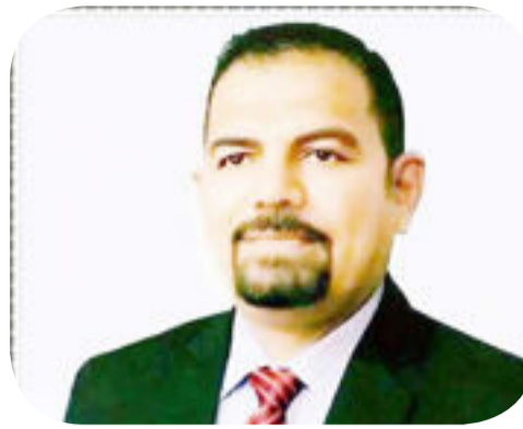
بقلم د علي رضا

المقيته وصراعاتنا فيما بيننا لونرجع الى تاريخ العرب لوجدناه لم تتوقف الصراعات البيئية عندهم من فجر التاريخ دول تكهره بعضها وقبائل تتربص لبعضها فلم نستطيع بناء