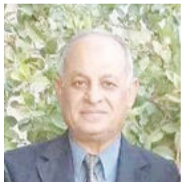
شعر : علي حسين علوان

يا عين هيمي بالدموع تحذني عن ذكريات بوحه حنين اذ كم حفظت من الجمال قصانداً للماضي فيها لهفة وأنين ماكنت ارسم في الظلام أمنياً يمحوها فجر بالليالي ظنين بل كان صبح الناس يحمل حلمه صوب الحقيقة والقطف ثمين ماكان يعترف بالظلام بوحشة