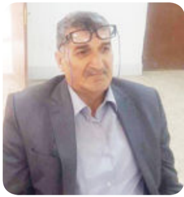
الشاعر / أمير الحلاج

أيها النائمون على شوك القارعة ما الجدوى من الوخر في خاصرة السور الجاني؟