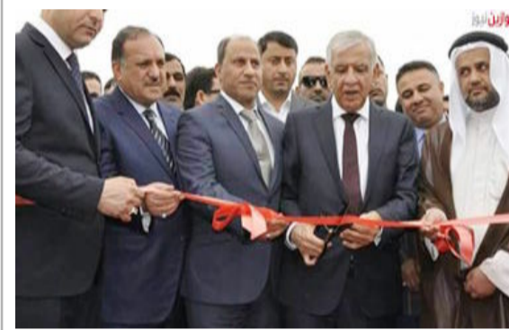
الناصرية- العراق الاخبارية

افتتح وزير النفط جبار اللبيبي، شركة نفط في قار، وتمهد بإحالة مصفى الناصرية الكبير الى الاستثمار. وقال النائب عن محافظة ذي قار محمد الكاش في بيان، إنه "تم على بركة الله افتتاح شركة نفط ذي قار التي لطالما انتظرها أبناء المحافظة طويلاً، تزامناً مع يوم الشهيد العراقي والانتصارات الكبيرة التي حققتها اجهزتنا الامنية من الجيش والشرطة الاتحادية وجهاز مكافحة الارهاب والحشد الشعبي على الارهاب الداعشي التكفيري". وأكد الكاش ان "وزير النفط جبار اللبيبي افتتح الشركة، وتعهد كذلك على إحالة مصفى الناصرية الكبير خلال النصف الثاني من هذا العام الى الاستثمار".