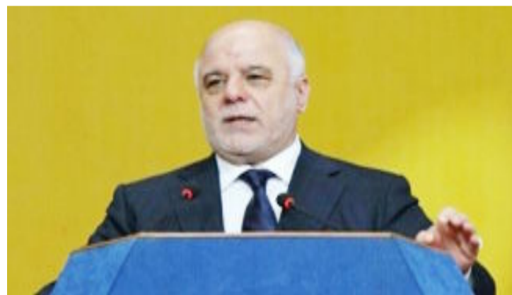
الى السيد محمد باقر الحكيم وأضاف "لقد اراد التكفيريون وبقياء البعث ان ينشروا القتل مرة ثانية «قدس»".

الاول والى الصفر". وأشار الى ان "التضحيات مضاعفة، فالضحية الأولى دخول داعش الى العراق وقتلها لابنائنا وسببها لنساننا واطفاننا، وتدمير البنى التحتية ومن فتحوا الابواب لداعش هربوا الى الضناق تذبج ابنائنا في الموصل والعراق وكل بقاع الارض ويتخذون الابناء دروع بشرية من اجل ان يرموا بكذب على القوات البطلة وهي اشرف منهم جميعاً ومن اتباعهم وانصارهم ويحاولون اتهام قواتنا ولا يمكن ان نسمح لهم بالعودة مرة ثانية ولن نسح بالعودة الى المربع