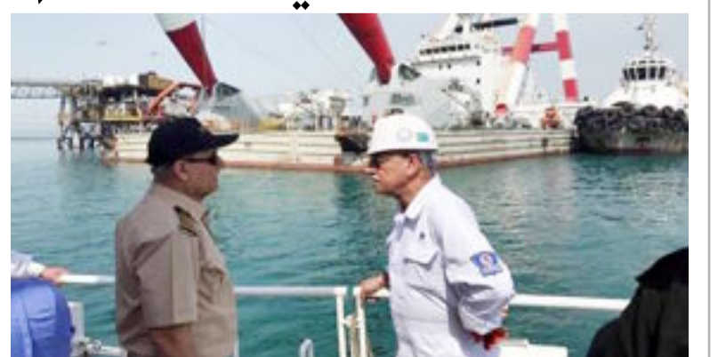
بغداد- العراق الاخبارية اعلنت وزارة النقل، عن إعادة الركيزة النفطية المتضررة بسبب العاصفة المطرية التي اجتاحت حوض الخليج العربي قبل بضعة ايام. وقالت الوزارة في بيان "تمت بعون

اللهم وبجهود الفرق الهندسية التابعة لوزارتي النقل والنفط اعادت الركيزة النفطية المتضررة بسبب العاصفة المطرية التي اجتاحت حوض الخليج العربي قبل بضعة ايام". وأوضحت أن "وزير النقل شارك شخصياً في عمليات الإصلاح بمشاركة مدير عام الموانئ ومدير السيطرة البحرية". وأوعز الحمامي، حسب البيان، بـ"تكريم جميع العاملين في ميناء البصرة النفطى من منتسبي الموانئ والنقل البحري نظير تضائهم بعملهم في تأهيل المنصة بوقت قياسي".