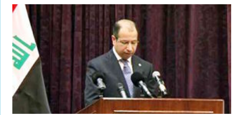
بغداد- العراق الاخبارية قال رئيس مجلس النواب سليم الجبوري، ان "وقت الحراك الحقيقي باتجاه استكمال الإجراءات العملية المتعلقة بالتسوية التاريخية، قد حان". وقال الجبوري، خلال كلمته في الاحتفالية المركزية بيوم الشهيد العراقي ذكرى استشهاد شهيد المحراب «قدس» التي اقيمت في مكتب رئيس التحالف الوطني السيد عمار الحكيم ببغداد، "كانت حربنا ضد داعش المشهد الأخطر والامم من بين تجارب العالم عبر التاريخ الإنساني في الشجاعة والاقدم والشهادة، لذا صار من اللازم ووفاء لدماء الشهداء ان نبدأ بمشروع الصالحة الوطنية الحقيقي وان نترك خلفنا كل الشكوك والتردد وان نثق

بقدرة جميعنا على اجتياز المرحلة باقل الخسائر". واكد ان "وقت الحراك الحقيقي باتجاه استكمال الإجراءات العملية المتعلقة بالتسوية التاريخية، قد حان، على أن