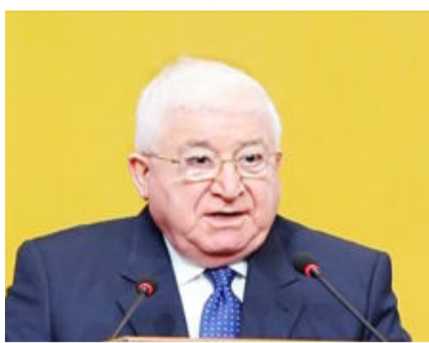
يعتز به الجميع". وأضاف، رئيس الجمهورية، "لابد من توحيد الموقف والمسعى بين مختلف أبناء

الشعب في الدفاع عن بلدهم وتجربتهم الديمقراطية، مشيراً الى ان "انتصارات القوات المسلحة في معركتها ضد داعش، كانت مبهرة ومفخرة لكل بطولات الرجال ولقد وفرت اجواء النصر والتقدم في الحرب على داعش افضل الظروف لوحدة الشعب وهذا ما يعطي رسالة واضحة لجميع القوى السياسية لتجاوز الكثير من مشكلات سوء التفاهم وبعض الجوانب من توتر العلاقات، للتقدم معا في مسؤولية روحية الوطن في بناء الدولة على اساس الديمقراطية ومبادئ المواطنة الذي يجد فيه الجميع صوته وتمثيله المتكافئ".