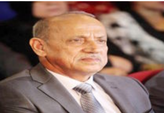
واسط- العراق الاخبارية