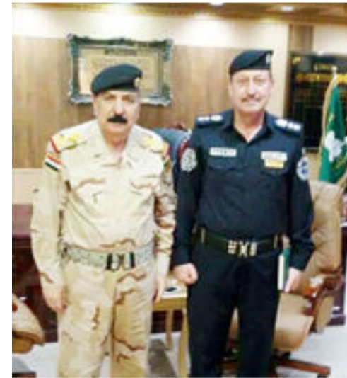
العراق الاخبارية - علي الصوفي

استقبل قائد عمليات دجلة الفريق الركن مظهر شاهر نصيف العزاوي العقيد الكيماوي حازم علي حسين مدير دفاع مدني ديالى وتضمنت الزيارة مناقشة اهم المشاكل والمعوقات التي تواجه الدفاع المدني وطرق معالجتها وقد اشاد قائد عمليات دجلة ببرجال الدفاع المدني وسرعة استجابتهم الى نداء الجوارث ونشر الوعي الوقائي للمواطنين وتعريفهم بهاتف طوارئ الاطفاء (١١٥) وأبدى سيادته كذلك على مدى العون والمساعدة لمديرية دفاع مدني ديالى في كل المجالات خدمة للصالح العام متمنياً لمحافظة ديالى والامان .