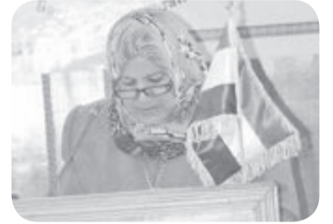
رفاه زايد جونيه

حيثما نمسي وقد غلغ الألم قلوبنا ولم نعد نرى الحياة الا من زوايا ضيقة مليئة باليأس وتونس تماما أن خلف كل زاوية من زوايانا المؤلمة يوجد