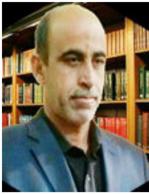
رسول مهدي الحلوي

قلب مع رفته تجشم قوارع الدهر ومع رهفته تكبد نوازل القدر. فلا شك أن بعض الصفات لا يحيطها المداد ولا يحتزلها الضطرطاس بل تسمو فوق الخيال وتحلق أعلى المثال ، هكذا هو قلب العقيلة زينب بنت أمير المؤمنين علي بن أبي طالب ( عليهما السلام ) .