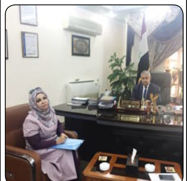
بغداد - اجتسام عراك