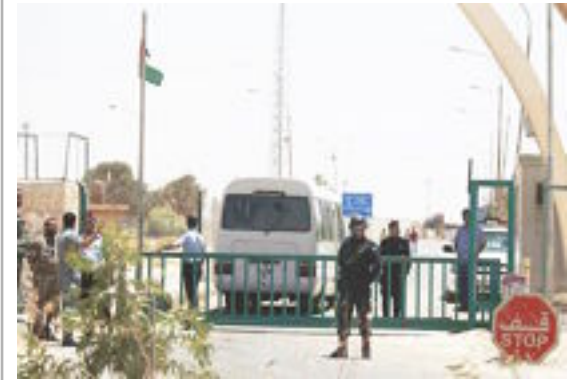
بغداد- العراق الاخبارية