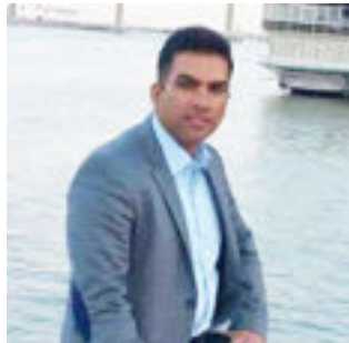
محمد السعيد / البصرة

جلست في حديقة الزهور مليئة بالعطور تذكرت صديقتي سيدة العطور وكتبت حينها كلماتي بين السطور * * * كلمات لها سحر حين تقرأها تضيء كأنها القمر حين تراه وقت السحر * * * سيدة العطور عطرك اصله من بلاد الزهور باريس بلاد الرقعة والرومانسية فيها تحلو الامسية * * * سيدة العطور يتك جثت من زمان واهديك ازهار شقائق النعمان وعطرها يفوح الى ابعد مكان بيروت وعمان