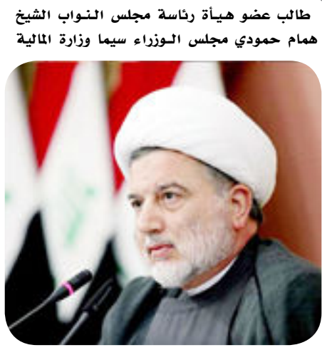
طالب عضو هيئة رئاسة مجلس النواب الشيخ مهاد حمودي مجلس الوزراء سيما وزارة المالية

بتحرك عاجل لمعالجة موضوع تأخير رواتب الكوادر التدريسية التابعة لوزارة التربية في بغداد والمحافظات، داعيا إلى معرفة أسباب التأخر والتكؤ في الصرف المالي لضمان عدم تكرارها مستقبلا. وشهدت الايام الماضية تأخيرا بتوزيع رواتب الكوادر التربوية التي عادة ما تتسلم رواتبها في الـ ٢٥ من الشهر، ما اثر ذلك على الاوضاع المعيشية للعديد من المدرسين والمعلمين. واكد الشيخ حمودي " اهمية اقرار مشروع قانون النقابات والاتحادات المهنية بما يضمن استقلالية ونجاح عمل كل منها، لافتا تقرب تفعيل خطوات اخرى لتوصيات حوار بغداد كتوفير السكن وبناء المدارس، اضافة لما انجز مؤخرا باستجابة وزارة النقل بتخفيض اجور النقل، والصناعة بتخفيض منتوجاتها للشريحة التربوية في البلد".