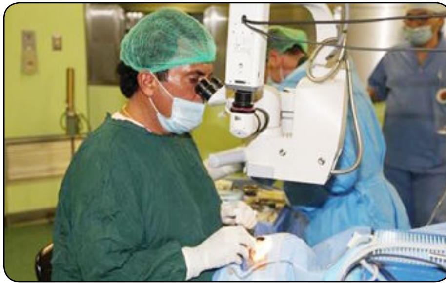
٦٨) عملية جراحية. ولفت الساندة عملت بشكل متواصل في اذ انجزت وحدة المختبر عيسى ان الاقسام الطبية تقديم افضل الخدمات الطبية (٩٣٢٥) فحص مخبري متنوع

فيما استقبلت وحدة التصوير الطبي ما يقرب (١٤٠٠) مراجع اما وحدة الأشعة فبلغ عدد مراجعها (١٠٨) مراجع في حين قدمت وحدة السونار خدماتها (١١٠٠) مراجع ، من جانب اخر حرص القسم العلمي على تنظيم العديد من المحاضرات والندوات العلمية لطلبة الدراسات العليا البورد العربي والعراقي في طب العيون ، فضلا عن قيام وحدة تعزيز الصحة بتنظيم مجموعة من الفعاليات والانشطة العلمية الى جانب توزيع عدد من الرسائل الصحية والفولدرات التي تحذر من خطر الاصابة بمرض الكوليرا وكيفية الوقاية منه حفاظا على الصحة العامة