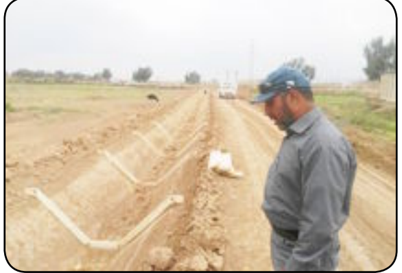
العراق الاخبارية / منى خضير عباس

اعلنت الشركة العامة لتجارة المواد الغذائية ان عدد العوائل التي جهزت بحصصها التموينية في الساحل الايمن من الموصل كانت ٢٥٧٩٦ وعدد افرادها ١١١٠٩٦ وعبر ١١٦ وكيل وذلك لفترة من ١٦/٣ ونفاية ٣٠/٤ .