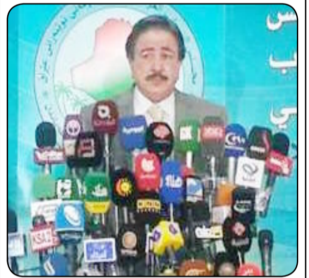
بغداد- العراق الاخبارية

أعلن رئيس اللجنة القانونية النيابة محسن السعدون، الاثنين، عن تقليص عدد المستشارين بالرئاسات الثلاث والوزارات إلى ثلاثة فقط، فيما أشار إلى أن هناك بعض الأطراف لا تملك الإرادة السياسية لتمرير القانون.