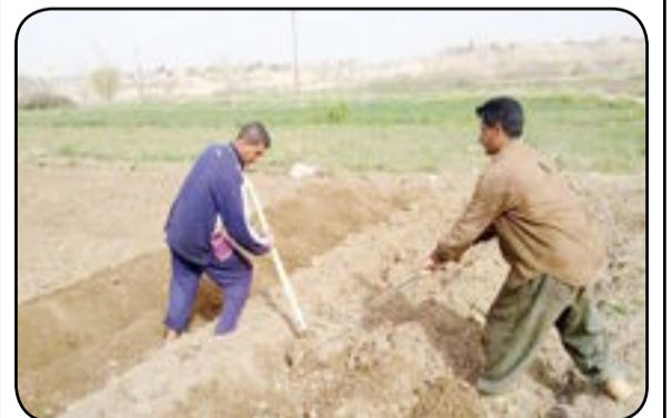
بغداد- العراق الاخبارية

أعلن مصرفا الرافدين والرشد، الاثنين، عن توفر السيولة المالية الكافية لدفع مستحقات الفلاحين في كافة فروعهما ببغداد والمحافظات، فيما دعا الفلاحين لتسلم مستحقاتهم. وقال مصرف الرافدين في بيان له إن "ما تردد من انباء حول عدم توفر الاموال لدفع مستحقات الفلاحين هي اخبار عارية عن الصحة وهدفها تشويه سمعة المصرف"، مشيراً إلى "توفر السيولة المالية الكافية لدفع مستحقات الفلاحين في كافة فروعها ببغداد والمحافظات". من جانبه قال مصرف الرشد في بيان له انه "مستمر يدفع مستحقات الفلاحين استناداً لتوجيهات رئيس الوزراء"، داعياً جميع الفلاحين والمزارعين إلى مراجعة فروعها في كافة المحافظات لغرض استلام مستحقاتهم من المحاصيل الزراعية. يذكر ان الحكومة وجهت وزارة التجارة بتوزيع مستحقات الفلاحين من الحنطة والشعير عبر فروع مصرف الرافدين المنتشرة في كافة المحافظات العراقية.