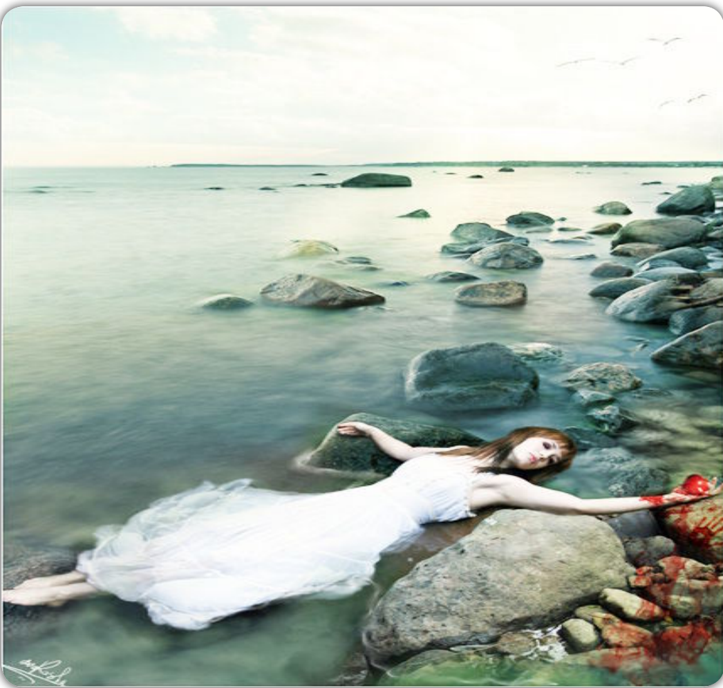
الشاعر وتمنيه قريبا منه.

تنسجين ، يرقص ، يضحك أنحت..) ونلاحظ ايضا تكرار أسلوب التمني ( ألا ليت ) والتمني كما هو معروف : هو طلب أمر مرغوب فيه لكن لا يرجى حصوله لأنه مستحيل ، فالشاعر يتمنى إمرأة يستحيل قريبا منه ، ولهذا قال " أنحت اجمل امرأة بقافيتي وازميلي ، ولعل من أبرز دلالات هذا التعبير هو قوة المرأة التي يتمناها وصلابتها ، كما نجده يصفها بالفرس المحررة