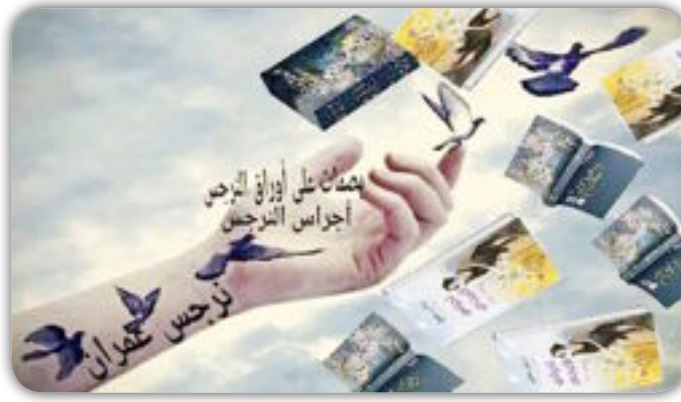
وانذهب دوما لكني أعود