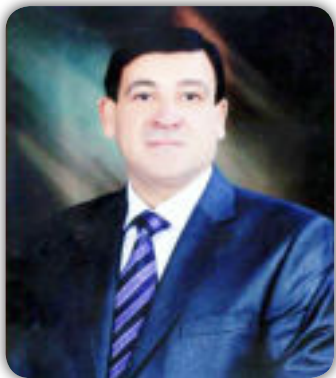
بقلم - عبد الرسول الاسدي