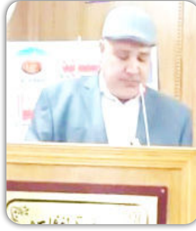
(لا سبيل اليك سوى

اختار شاعرنا بيئة صحراوية ليصب فيها تجربته من خلال التشابه الذي يجمع الحاليتين فهو يعاني فورة هجر من حبيب لا يتوانى في إيلائه وصحراء تمتد على أفق البصر لا توفر ملاذا لعطشان أو ظل لمن احرقته الشمس ، (الى واحتكك اذب السير وسط يباب..) هنا كان التماهي في تشكيل الصورة عند اختياره لمفردة العطش وما يقابلها في الحلم هو وجود الواحه وكلما غن السير في ذلك النية لا تلاقيه سوى اهلوال الريح حين تصفر في اعماق روحه غير مائل خلفه الرمال من تشتت في الرويا وتوهان في لجة الافق