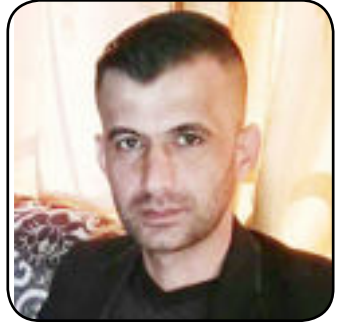
بقلم / ذوالفقار الخشالي

الوطن هو الدار الذي يحتضن ابنائه ويربيهم ويعلمهم على حب الحياة ونحن نفتخر بوطننا العراق مصنع الرجال والابطال حيث يشهد لهم التاريخ منذ زمن بعيد والى يومنا هذا اصحاب (الغالة والمكوار) من اجدادنا الذين كتب عنهم التاريخ وخدمهم الى اليوم الموعود في عشرينيات القرن الماضي حينما قاوموا الانكليز عندما احتلوا ارضنا ارض الحضارات الأرض التي نزل فيها آدم (ع) والنبي إبراهيم (ع) ويونس (ع) ودانيال (ع) وغيرهم من الانبياء والأئمة والصالحين وعلي بن ابي طالب عليه السلام والحسين والعباس (عليهم السلام) وموسى ابن جعفر وأبي حنيفة النعمان وعبد القادر الكيلاني كل هؤلاء احباب الله ومن العترة الطاهرة التي بنت الأسلام . لنا الفخر أن نكون من العراق والدار التي لها تاريخ مشرف وصولات ضد من عاداها وحاول أن يندس ارضها ومقدساتها هي الأرض السوداء الصافية بسمائها ومائها وبساتينها المطلة على نهريها العظيمين بجلة والفرات وطيبة اهلها وأثاره العظيمة في بابل وهور الجبايش وسامراء وغيرها من الآثار التي تجذب السواح من البلدان العربية والأجنبية وغيرهم من البلدان الاخرى ولنا الفخر بأن نكون من هذا البلد الذي يوجد فيه تراث منسوب الى آلاف السنين . اللهم احفظ العراق من كل مكروه و وفق شعبه العظيم يا أرحم الراحمين