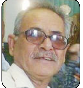
شعر / ياسين خضر القيسي