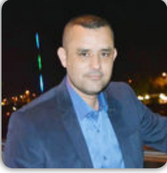
شعر / خالد جمال