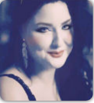
العشق ليل وسهر

على صوت ناي او وتر وعيون في حدقاتها بشر تفكر فيهم مع القمر تتمنى يأتون من السفر لنعشقه وتكمل معهم الدهر وعيون سود بزموش كانها انت لتصيب البشر وهمسات كهديل الحمام رق لها الحجر وقلب من العشق خفقت دقاته كأنه انتحتر ياروحي انهي فأن الجسد قد افتقر القلب لا يعرف وقت ضحي ام سحر ينبض للروح وللارض وللسماء ولعشق بعض البشر