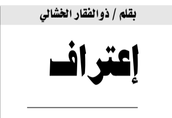
بقلم / ذوا الفكار الغشالي

فأنت لأرسم لك ولا شفة لك ولا اسم لك ولا أنا لك فكيف أنيت بين شفتي وكيف اعتليت نهديك وهن يجلهن صمتي فأنا وانت ومدينتي سنبقي بصمت