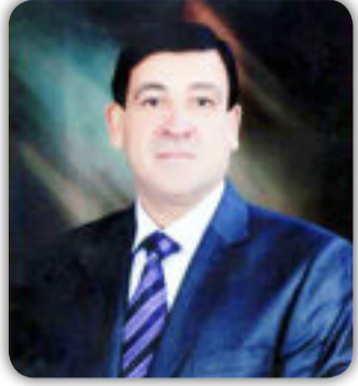
بقلم - عبد الرسول الاسدي

عندما تخفق اول مرة في ان تصيب هدفك فان ذلك يدعى بالا خفاق.