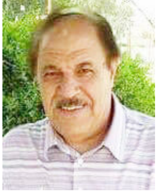
بقلم / أنور الربيعي

ومستقبل مجهول فواقنا اليوم يكاد يخلو من رسالة محمولة او مبدأ له اصله او قيمة من قيم هذه الانسانية فأصبحنا كمثل ملحمة همجية بسيف صدمة