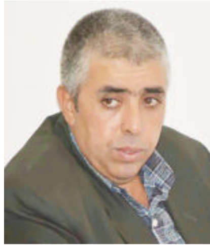
بقلم / حسن الشكرجي

إن من عادات الأمم والشعوب الافتخار بعلمائها ومثقفها . ولقد زخر العراق بعلماء ومثقفين قل نظيرهم في كل مجالات واصناف العلوم .