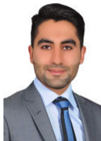
بقلم / مصطفى كريم

الاموية نحو ألف محطة وكانت فترة البريد الذهبية في سبعينيات القرن الماضي تزامناً مع تطور وسائل النقل بين مختلف الدول ، وما ان ظهر الفاكس كأول علامة على تطور وسائل التواصل بدء خدمة البريد بالانترنت فقد قضت تطور وسائل التواصل الالكتروني تماماً على تلك الخدمة الا بالمخاطبات الرسمية ، فلا يخلو شخص من امتلاكه للبريد الالكتروني الخاص للتواصل الاسرع فقد لايتجاوز ارسال رسالة الكترونية دقيقة واحدة اذا اصبحت الرسالة تفقد الى تكهتها كما كانت في السابق .