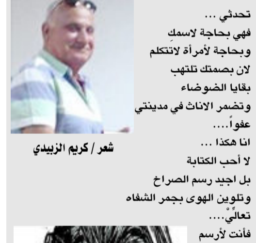
شعر / كريم الزبيدي