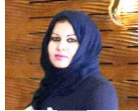
بقلم انوار عبد الكاظم الربيعي

قل انا العراق قل ماقتلوني وما صلبوني ولكن ظلموني ليضع سنين سهوا رفعت إلى حضرة الخلد وإن سألوكم عني فقل انا الموصل انا البصرة وانا بغداد إني نزحت إلى ؛طور سنين ويمحنني الوصل بالروح في كل حين