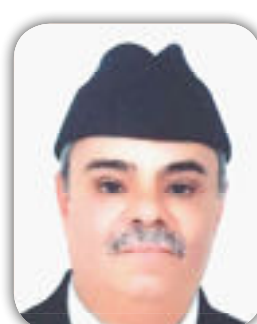
بقلم / أحمد المرواني

في واحدة من النهايات القوية والتي يصلح ان نقول عليها مباراة نهائية لما تحمل من الندية والصراع القوي ما بين الفريقين تقابل الالمان ويتشكل شبابي صرف مع الفريق الشبلي صاحب الخبرة في نهائي كاس القارات التي جرت احدائها في روسيا فبالوقت الذي سيطر الشيليون على مجريات المباراة وكانوا هم الاقرب للفوز بالبطولة جاءت الريح بما لا نهوي السفن حيث سجل الالمان هدفهم من حط دفاعي قاتل كلف شيلي خسارة اللقب ومع تاخر شيلي