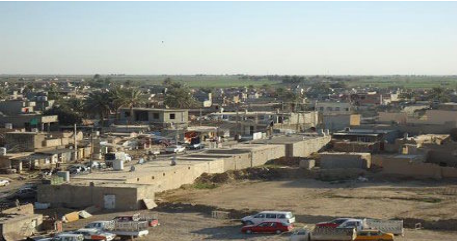
الخبير القضائي - حسين داود سلوم