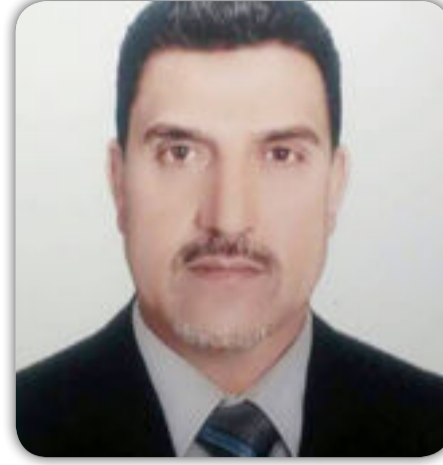
بقلم / سمير السعيدى

لم تتابع تفعيله لم تتناسب المقصر بهذا الاتجاه لانهم مشغولون بتشريع ما يخص رواتبهم وامتيازاتهم تارة وبكيفية الاستحواذ على اكبر قدر من المنافع الشخصية والفئوية والحزبية وبأسهل السحت الحرام من المال العام وهذا ما أكده معظم البرلمانيين على الفضائيات ووسائل الاعلام المختلفة دون حياء . ان فساد السلطة التشريعية وابتعادها عن هموم الناس هو احد الاسباب الرئيسة في ايجاد العشوائيات. ثانياً : السلطة التنفيذية ( الحكومة ) لها دور كبير من خلال التلكؤ في تخصيص الاراضي للناس حتى حسب السياقات القديمة وان تم تخصيص وهو نادر الحصول فيكون في مناطق تكاد تكون نائية والعقل يقول لم تصلها الخدمات وفق المعطيات