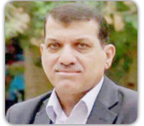
بقلم / بكر ضاري

مرة أخرى تثبت أندية المحافظات انها في الاتجاه الصحيح وخاصة فريق الديوانية وفريق السماوة والذين اثبتوا أنهم كبار . ففريق الديوانية أتى الى دوري نخبة بجدارة والسماوة بقي بجدارة .