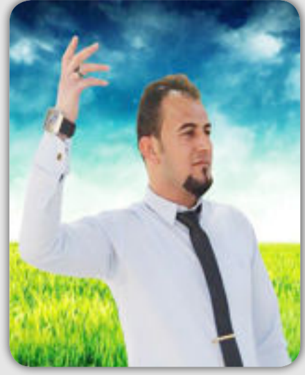
شعر / مصطفى الشيخ