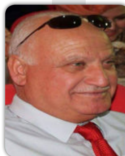
شعر / كريم الزبيدي