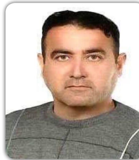
بقلم / فرقد الجويري

تشهد السياسة العراقية الخارجية هذه الايام انفتاحا ملحوظا نحو المحيط العربي وعودة للعلاقات بين الاصدقاء بعد فترة من الجفاء والاحتقان في وقت يتزامن مع الانتصارات الكبيرة لقواتنا الباسلة في الموصل وتلعفر... والذي حولت بوصلة السياسة الخارجية لدول الجوار العربي