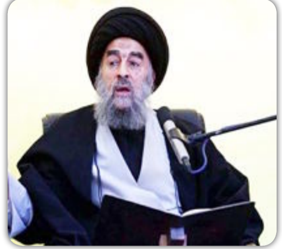
العراق الاخبارية / كربلاء المقدسة

عزّاه المرجع الديني آية الله العظمى السيد محمد تقي المدرسي، دام ظله، نشوء المشاكل في العراق والمنطقة إلى "التخلف الحضاري"، فيما حمل "الأنظمة البالية" مسؤولية التراجع الاقتصادي فيها.