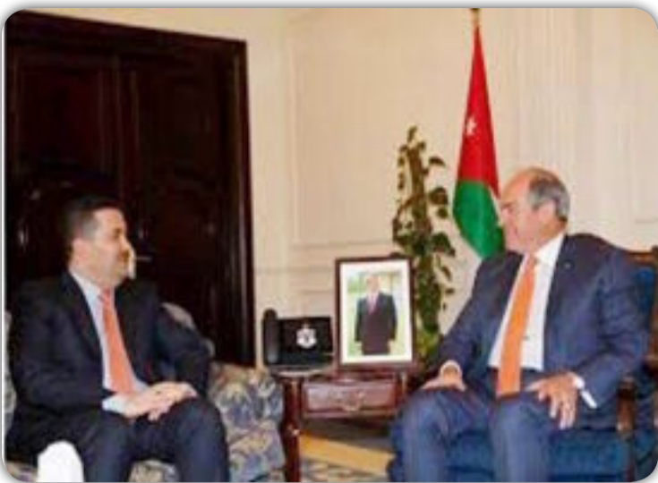
صفية السهيل يوم الاحد 10-9-2017 الصناعية الوطنية وحرصية على فتح افاق التعاون امام المستثمرين ورجال