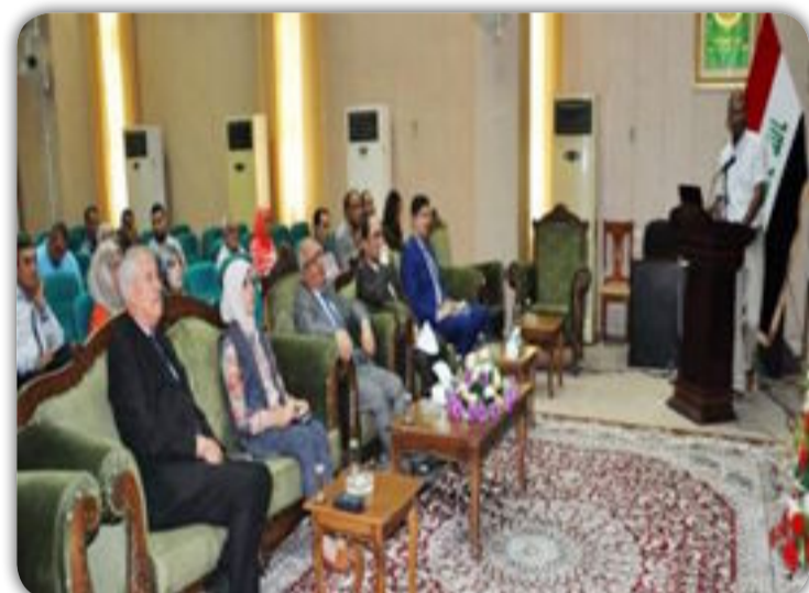
من خلال دراسة محتوى الرطوبة في التربة، تناولت الدراسة تقييم كفاءة أنظمة الري بالرش والتنقيط من خلال إجراء القياسات والحسابات لكفاءة