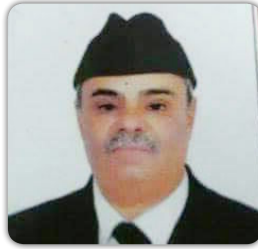
بقلم / أحمد المرواتي

ونحن نعيش الأيام الأولى للعام الهجري الجديد ١٤٣٩ سائلين المولى القدير ان يجعله عام خير على امتنا الاسلامية وعام وكانوا يودعون اماناتهم عنده لما يحمله محبة وسلام على عراقنا الغالي نستذكر