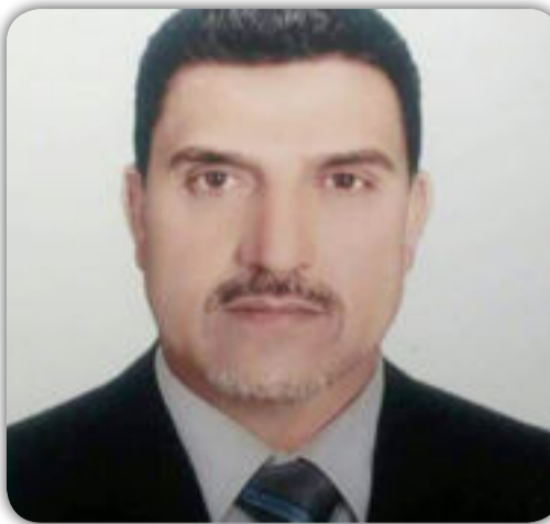
بقلم / سبير السعيد

ثانياً : الارض الخصبة لزرع النفور من العلمانية واقتصد هنا المجتمع حيث ان المجتمعات في الدول الاسلامية ومنها المجتمع العراقي تربت منذ بداية الرسالة الاسلامية الى الآن على الانقياد تحت امره رجال الدين السياسي وكان هذا واضحاً ايام الدولة الاموية مروراً بالدولة العباسية وصولاً الى الدولة العثمانية وكانت رهبة الحاكم الديني هي من تسيره بل جردته من حقوقه حتى في التفكير في ايجاد الحلول وكان الانصياع لحكم الدولة كامل مع عدم القدرة على التعبير عن الرأي . وهذه تركة ثقيلة شعشت داخل عقول الافراد منتقلة عبر الاجيال لايمكن افرغها بسهولة واستبدالها بما يتناسب وحيوة مجتمع