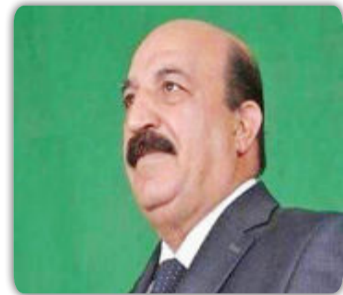
بقلم / جمال شاكر الربيعي