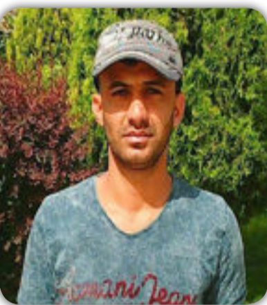
شعر / ذوالفقار عبد الحسين

يا إمام الخلق مرحب فشوقي بعيني يتألاً ان غبت عنه عزراً فدمعي لرؤياك يسكب يا ابا ابراهيم انت لا ترد حاجة لتطلب قضى الزمان لي متعب حضرتك يا باب الحوائج مضرب فوق رأسي من هم الزمان ولي عندك مطلب ان ترد الصحة الذي قضى الزمان لي متعب