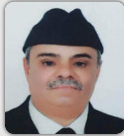
بقلم / أحمد المرواني