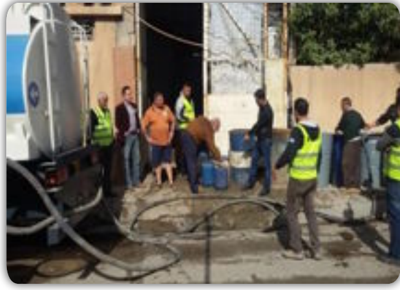
العراق الاخبارية / محمود عناد مشعل

اطلقت شركة توزيع المنتجات النفطية البطاقة الوقودية رقم (٧) لتجهيز المواطنين بمادة النفط الابيض بكمية (٥٠) لتر اعتبارا من اليوم الاحد الموافق ٢٠١٧/١٠/١٥. وقال مدير عام الشركة كاظم مسير ان منافذ التجهيز باشرت اليوم بتجهيز المواطنين في محافظة بغداد بمادة النفط الابيض بكمية ٥٠ لتر باعتماد البطاقة الوقودية رقم (٧) فضلا عن استئناف العمل بالجزء السفلي من معلومات قسيمة الاستبدال للبطاقة الوقودية السابقة (السفالة) بواقع ٥٠ لترا ايضا واعتبارا من يوم امس الاحد الموافق ٢٠١٧/١٠/١٥. واكد مسير ان تجهيز قسيمة الاستبدال السابقة سيكون من المنافذ التوزيعية حصرا بالإضافة الى البطاقة الوقودية الجديدة المشار اليها لافتا الى ان الوكلاء الجوالين سيقيمون بتجهيز المواطنين بالبطاقة الجديدة رقم (٧) فقط. ودعت الشركة المواطنين الاسراع باستلام الحصص المقررة من النفط الابيض من المنافذ التوزيعية تامينا لاحتياجاتهم خلال فصل الشتاء المقبل. يذكر ان الوزارة باشرت بعمليات تجهيز النفط الابيض منذ شهر تموز الماضي لتأمين خزير جيد للمواطنين خلال فصل الشتاء المقبل، بهدف تحقيق انسيابية عالية في عملية التوزيع وهو سياق اتبعته الوزارة في الاعوام السابقة.