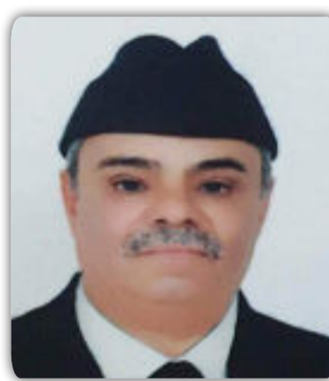
بقلم / أحمد المرواني

الدستور. فعليه فان الواجب الوطني يلزمنا بطرح آرائنا كطبقة مثقفة في المجتمع. فنقترح الآتي : ١- تشكيل لجنة نيابية مكونة من خبراء بموضوع الدستور قوامها ممثلين من كافة الكتل نسميها لجنة متابعة تنفيذ بنود الدستور ويكون ارتباطها اما برئيس البرلمان او برئيس الوزراء مهمتها المحافظة على هذه الوثيقة السياسية المهمة. ٢- تطلع هذه اللجنة على كافة القرارات التي يكفلها الدستور العراقي وتعطي رأيا فيما اذا كان القرار يوافق الدستور او لا يوافق الدستور.