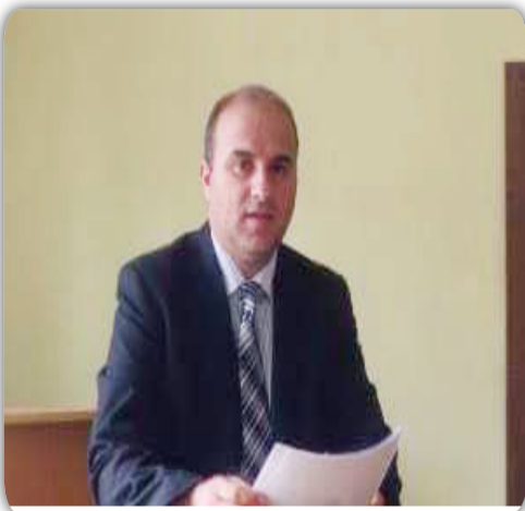
بقلم ... منعم الزهيري

أما سوريا فلها نفس الشيء من الخطر الذي سوف يلحق بوحدتها بسبب انفصال اكراد العراق ولنفس الأسباب التي ذكرتها بخصوص تركيا وإيران . حيث شكل الأكراد نسبة ١٠٪ من سكان سوريا وتقدر الإحصائيات الغير رسمية بأن عدد الأكراد في سوريا تقريبا ٣ مليون كردي من أصل ٢٣ مليون تعداد الشعب السوري . لذلك بالتأكيد فان هذه الدول سوف تقوم بكل ما بوسعها لمنع قيام الدولة