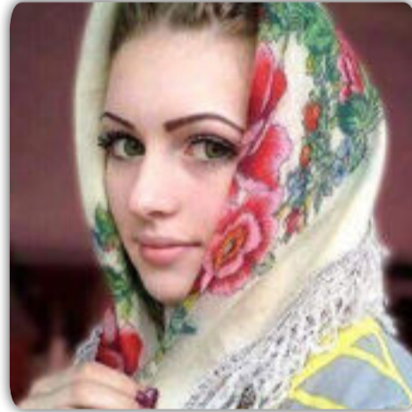
بقلم / نور السماء