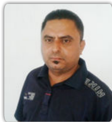
بقلم علي محسن السعدي

يعتبر الدستور هو المرجع الوحيد لخلافاتنا وهو الضامن لوحدةنا فمن خلاله تصان الحرمات وتتساوى الحقوق والواجبات فهو مصدر القوة للشعوب فكل نظام لا يوجد فيه دستور يعاني من الفلتان والفوضى وفي جميع مفاصله فالاكتكام إلى الدستور يعني حلحلة جميع خلافاتنا وبالطرق القانونية ولاحضنا وللاسف في الأيام القليلة الماضية الخرق الدستوري من قبل كردستان وقدمهم على إجراء الاستفتاء القيردستوري وأنصاعهم إلى أجدات خارجية لاتريد النظام أن يطبق في العراق وهي تعتاش على الفوضى والدمار فنقول لرئاسة كردستان فكافك تمزيقاً لوحدة العراق فالعراق واحد بشعبه واهله لا ينصاعوا الى مخططاتكم التجزئية التقسيمية المراد بها تطبيق نظام عنصري يخدم بني إسرائيل فنقول كفاك يامسعوديا المتاجرة باخوتنا الاكراد فياشعب كردستان لاتسمحوا ان يريدم تمزيق بلدكم وهناك رسالة من اخوتكم في الوطن أود أن ألقها اليكم يقولون فيها اننا كنا معكم في نفس الطريق إبان حكم الطائفة صدام فكانت تظلماتنا وجراحنا واحدة فالنكمل الطريق سوياً ونقف وقفة الرجل الواحد ضد دعاة التقسيم والخارجين على القانون ممن يعتاشوا على الفوضى وأخيراً اقول لشعبنا في كردستان أن عراق بلا قانون يعني قتل بالشوارع وتزهق الأرواح بلارادع ولا محاسب فبتطبيق القانون يعني تصان الحرمات وباخذلكم نوحق حقة وبالتساوي .