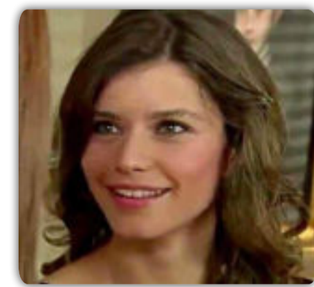
شعر / سماح خالد

هل تعلم أميري ومعلمي ... أنني بجانبك كالطفلة العذراء شعيرة صغيرة بصوف الشعراء أو أنتى معرفتها بالحرف كقطرة ماء أرتشف الحروف من بعد ظمأ بلا إرتواء وبظلام جهلي أحيوا طويلاً دون ضياء حبيبي علمني .. وأقرأني كل حروف الهجاء بكل حرف فقرأه وتكتبه بأشعارك ورواياتك حتى بأوراقك البيضاء فمن شيم الشعراء الكرم والكبرياء فكن لي الأهل والأصدقاء والخلاء فليس كل منّا خلق شاعراً .. أدبياً أو حكيماً من الحكماء