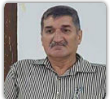
الشاعر أمير الحلاج

الخراف الأليفة عن بعد تشم رائحة الجازر كلما هجم الهزال أو تلبس غلاف الراعي ، لا تمارس توقف السير أو ترسم إشارة الاعتراض أو الخروج عن سيطرة الخنوع فقط الغناء وسيلتها الساطعة