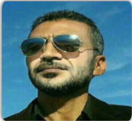
بقلم / نوفل محمد

في الثالثة من عمره يلتقط الكثير من الجمل وفي الخامسة يجهز لمعرفة الجزئيات وفي العاشرة بإمكان ضربيه على كنيته الكثير والكثير من السلبيات علما إن أكثر الأطفال