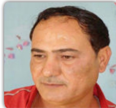
الشاعر / علي فرحان