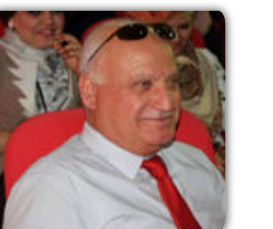
شعر / كريم الزبيدي

تلك صورة أنتى ماض كسرت صمتي المجنون تحديق إلي ... اتلون خجلا لايعرفني احدا كي اخشاه لكن اخشى ان تفتح الباب وانظر حولي يا إلهي ... مامن احد يبيعي منديلاً اشعر خجلا حين انهزمت مجددا فاني لن اجد احدا يعرفني في اللوحة فقررت شراء دموعي وتركت اللوحة على الجدار