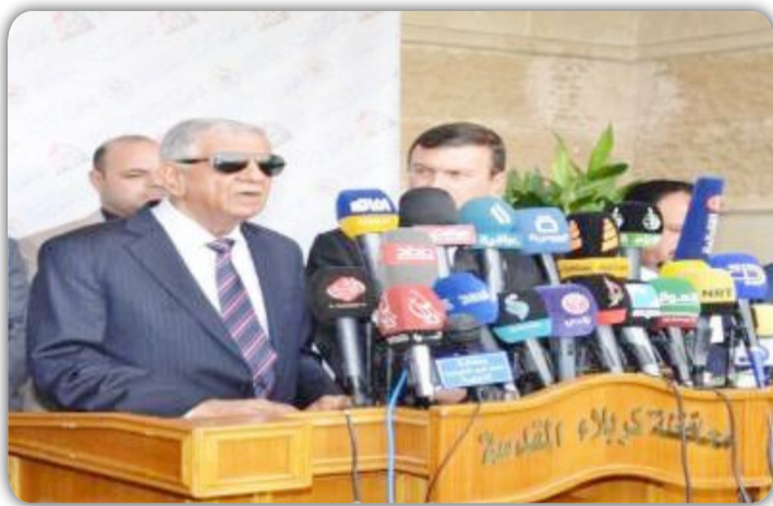
بالمباشرة بتنفيذ وانجاز الطريق الستراتيحي الذي يربط عدد من محافظات الفرات الاوسط وبطول ٨٠ كيلومتر وبالتعاون مع الحكومة المحلية في المحافظة لما يمثله من أهمية كبيرة في تحقيق انسيابية

او عز وزير النفط جبار علي اللعبي للملاكات الفنية والهندسية في شركة توزيع المنتجات النفطية وتشكيلات الوزارة الاخرى بتنفيذ مشروع الطريق الستراتيحي الرابط بين محافظات كربلاء المقدسة والنجف الاشرف وبابل ، بطول ٨٠ كم. واكد وزير النفط حرص الوزارة على تنفيذ عدد من المشاريع الخدمية والاجتماعية والانسانية وفق الامكانات المتاحة ، مساهمة من الوزارة بالوقوف الى جانب ادارات المحافظات في الارتقاء بمستوى الخدمات المقدمة للمواطنين . وقال وزير النفط جبار علي اللعبي انه او عز الى شركات الوزارة