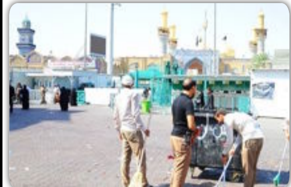
انتقدت إدارة العتبة الكاظمية المقدسة بشدة دور امانة بغداد ودائرة بلدية المدينة.

وذكر بين لاعلام العتبة المقدسة: هل تعلم امانة بغداد ودائرة بلدية الكاظمية بكمية النفايات الموجودة بالشوارع القريبة على العتبة الكاظمية المقدسة ام تحتاج لأدراج الصور هنا ليرى العالم حجم تقصيركم وأهمالكم في اقدس الأماكن في بغداد والتي تستقبل الملايين من الزوار الاجانب في هذه الايام