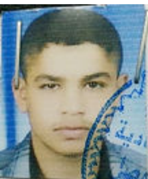
مجلس القضاء الاعلى