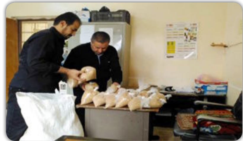
تستمر وحدات وقاية المزروعات في عدد من الشعب الزراعية التابعة لمديرية زراعة بابل بحملاتها المجانية لمكافحة حشري ذبابة الياسمين وسوسة النخيل الحمراء، وكذلك القوارض في بساتين أبي غرق. وبحسب إعلام وزارة الزراعة فإن شعبة زراعة السدة

مستمرة بحملتها المجانية لمكافحة ذبابة الياسمين البيضاء في بساتين الحمضيات، فيما تواصل الشعبة ذاتها نصب المصائد الصفراء التحري عن كثافة الحشرة، مضيفاً إن لجنة متخصصة أخرى تجري بمسحا مماثلاً للتحري عن سوسة النخيل التي تهاجم النخيل. وفي ذات السياق تستمر وحدة الوقاية في شعبة زراعة أبي غرق بحملة مكافحة القوارض باستخدام مبيد ستروم وإشراف مباشر من كوادر الوقاية في الشعبة. يأتي ذلك في وقت تستمر شعبة زراعة السدة بتجهيز الفلاحين بالأسمدة الكيماوية للموسم الحالي ٢٠١٧ / ٢٠١٨ لمحصول الحنطة والشعير، فيما تواصل شعبة زراعة الشمولي انجاز معاملات تجهيز الأسمدة لمحصولي الحنطة والشعير للموسم الشتوي.