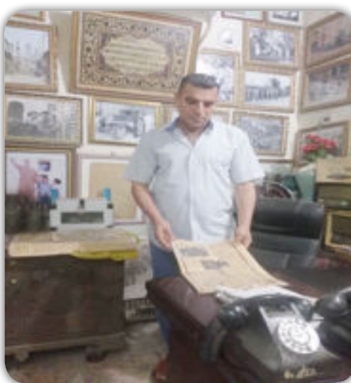
للمدن التي تصنع هذا المنتج ....

فيقول الاستاذ صباح ان التحفيات تنقسم الى عدة اقسام ومنها السبج والمحابس ،اما السبج منها الكهز والسندلوس والبالي زهر اما المحابس فقيمته بالاحجار التي تتوسم المحابس ومنها الحجر السليمانى والعقيق اليماني .والرضوي والفيروزي ....اما السجاد فله محبيه ومقتنيه ..ومنه السجاد الكاشاني وال سجاد التبريزي والسجاد الطهراني .وهذه المسميات طبعا