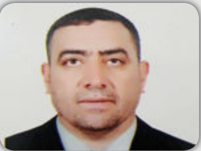
بقلم الدكتور / رعد غالب الندوي

لا يزال الجدل قائماً بين مؤيدي ومعارضين في تخصصات فقهية وقانونية واجتماعية وتربوية وشرعية وبرلمانية ومنظمات مجتمع مدني ، فيما طرح في قبة البرلمان من مناقشة تعديل قانون الاحوال الشخصية في البلاد وردود افعال غاضبة في الشارع العراقي واعتبره الكثيرون بمثابة نكبة في مجال حقوق المرأة وتعزز حالة الانقسام الطائفي والمذهبي لانه حدد الزواج حسب المذهب السني والشيعي وتفويض الوقيين السني والشيعي بالموضوع الى جانب المحكمة لذلك يرى البعض ان الرؤية الشرعية لهذه القضية لا يمكن اهمالها وان النصوص الشرعية هي الحاكمة في مثل هذه القضية والتي تجيز زواج الفتاة الصغيرة وتعتبر ان تحديد سن زواج الفتاة تجاوز على احكام الشريعة الاسلامية وبالقابل يرى اخرون ان هذه القضية تسيء للفتاة الصغيرة واسرتها ومجتمعها لانها غير مهياة نفسيا وجسديا وفسولوجيا ولا يمكن تجاهلها على اعتبارها طفلة وتصبح اما لديها اطفال صغار لتلك سنتها الايام المقبلة انفرجا وتوضيحا وقرارا حازما في هذه القضية المنيرة للجدل لانها من الموضوعات التي لاقت اهتماما كبيرا في الاوساط الشعبية والاجتماعية والحكومية .