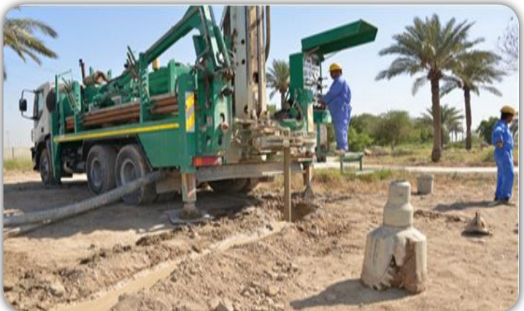
تم انجاز (٨) ابار في مناطق وقرى عديدة من المحافظة مثل بئر محمد حيايو عبد علي بالإضافة الى حفص (٢)بئر فيها . اما في محافظة النجف

بئر لسد احتياجات المحافظة للمياه بالإضافة الى السعي الى اعادة احياء الصرح الحضاري لنصب الشهيد حيث تم حفر (٨) ابار في الموقع لاهمية هذا الابار في تغذية البحيرة الموجودة هناك لقلّة المياه الواردة اليها بالإضافة الى حفص (١٣) بئر في المحافظة اما في محافظة كربلاء المقدسة فقد تم انجاز (٦) ابار لتوفير المياه لمواقع مهمة في المحافظة منها (٤) ابار في الحماية الكاثودية وبئر مصنع المذاق المميز وبئر مكي شمخي بعرق (٢٧٨)م بالإضافة الى نصب (٤) طواقم ضخ و صيانة (٤) طواقم فيها. وللمعالجة شحة المياه في محافظة بابل