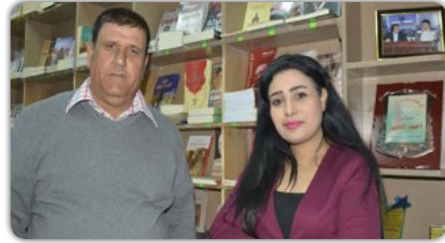
كتب / محمد رشيد الدفاعي

تعتبر نقطة البداية نحو الطريق الصحيح وتحقيق ماتنتغي اليه، كيف لا وهي ابنة إعلامي كبير صدح صوته من خلال الإذاعة والتلفزيون على مسامح المشاهدين وحفر اسمه في ذاكرة جيله من الوسط الإعلامي والثقافي بل وتعدى ذلك إذ بدأت الأجيال القادمة تعرفه من خلال الملتقى الإذاعي والتلفزيوني الذي كان يرأسه ويستضيف ويحتفي بشخصية فنية في كل يوم ثلاثاء ، يوم 24/11/2017 هو موعد إعلان وافتتاح (دار ومكتبة احمد المظفر) في شارع المثقفين (المتنبي) في مجمع