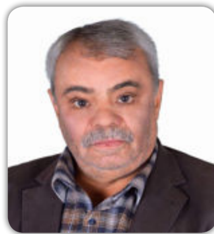
بقلم / أحمد المرواني

(عربة السندريلا) مقال صحفي للكاتبة الزميلة مريم فؤاد نشرته جريدة العراق الاخبارية بعددها المرقم 471 والصادر في 19/10/2017 يحكي المقال قصة الكادحة العراقية التي تعمل بكل تفاني وشرف من اجل توفير لقمة العيش لعائلتها حتى وان كانت تلك الاعمال ليست ملائمة لطبيعة المرأة فمن خلال المقال ان هذه العراقية تعمل بالقمامة فتقوم يوميا بدفع عربتها الفضية لتجمع ما يمكن بيعه من تلك القمامة لتقوى على صعوبة المعيشة واثناء عملها جاءها رجل لينا فاسها في العمل ثم باع ضميره وباع رجولته بأبخس الأثمان وبدأ بالتحرش بتلك