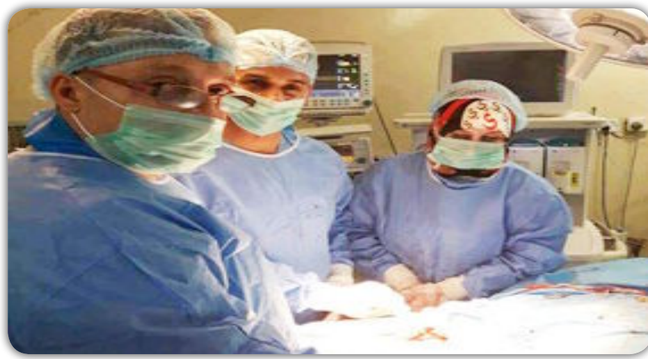
إن "المريضين، كانا يشكوان قبل مجيئهما للمدينة الطبية من آلام شديدة في القدمين والساقين، التي سببت لهما عدم القدرة على النوم، وصعوبة في الحركة، وبداية كاتكرين في القدم"، مبيّناً