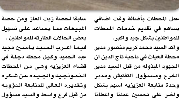
ياسم /كافم حسين الزبيدي