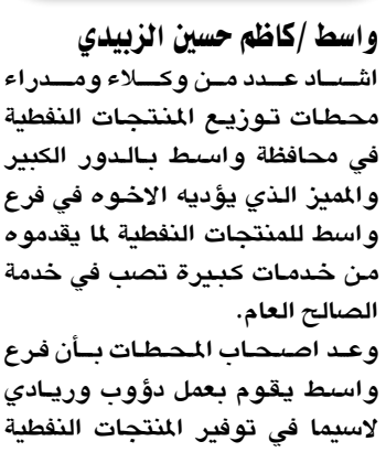
ياسم /كافم حسين الزبيدي