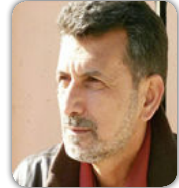
بقلم عبد الرضا القرشي