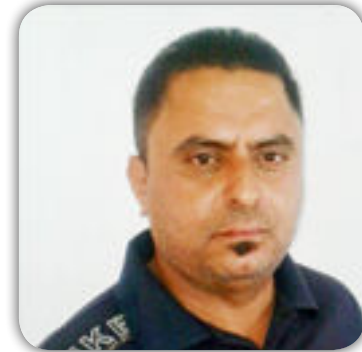
بقلم : علي محسن الموسوي

لوتبتعنا الاحداث التي مرت على وطننا العراق لاكثر من ثلاث غرون ابان حكم الطاقية الملعون للوحضنامدى الأحداث والمجريات التي صاحبت ابناء شعبنا العراقي الصنم تاملنا خيرا فقلنا ولازم القتل والتكيد قذولوا مابرح العراقيين فقد ظهر لنا وللعيان سياسيون صداميون من نفس الطبقة ونفس اللون فهم ادعاء السلام ويعصقون والامان لا يهتمهم شئ سوى القتل والدمار والتخريب وهذا هو دينهم بأن يبقى الوطن والمواطن تحت وصاياهم الداعشية الوهابية لا يلبق لهم ولا اتباعهم أن يروا العراق تسوية الاخوة الونام والتكاتف والتعاضدين جميع اطبافة ومسمياتة فهاهم قد نسوا أن في العراق رجالات تردهم إلى دابهم فشت كل مخططاتهم الشيفونية والعنصرية فعدوا بنا شعبنا العراقي بكل مايملك من قومن خلال تصديهم لطواقيت العصور من لف لفهم فمذنا سبب نواة عسكرية حشداوية مباركة من قبل مرجعيتنا الرشيدة وهذه النواة العسكرية سميت بالحشد الشعبي ولانسانا تحضية ابناءنا في القوات الامنية من الجيش والشرطة وهم سطر وأروع التضحيات ضد داعش الإرهابي الوهابي واليوم نحن نفتخر جيشنا وحشداوناهم يحققوا الانتصاري الانتصار وهذا النجاح ليس للمؤسسات الامنية فحسب بل لجميع العراقيين بكل أطبا فهم ومسمياتهم واليوم نفتخر جيشنا وحشداوناهم علموا ولفقوا ادعاء العراق الدواعش درسالم ينسوة ابدأ على مدى التاريخ واليوم نقول لاعداء العراق كفاكم لعب في النار فالعراق فية أبطال لن يرمش لهم جفن ولا تنام لهم عين فهم أبطال بحق والل